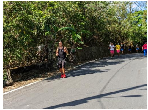
說明：教師橄欖山晨跑