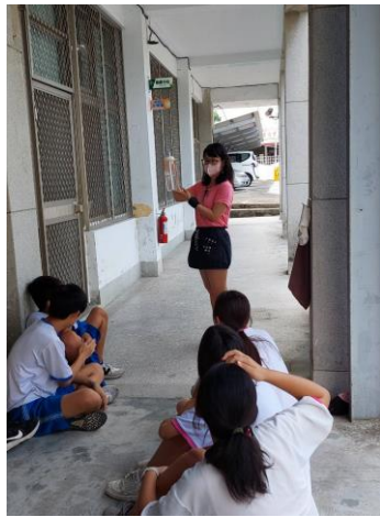
說明：教師進行健康飲水宣導