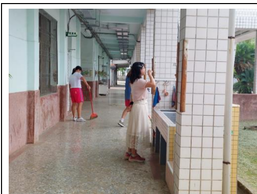
說明：教師飯後刷牙