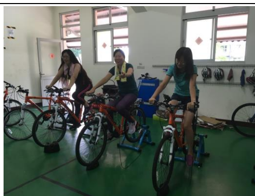
說明：教師單車社團