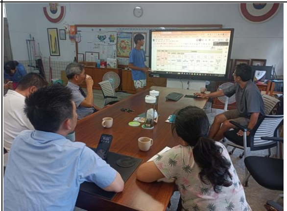
說明： 學生單車教育結合資訊成果分享(校內外人士)