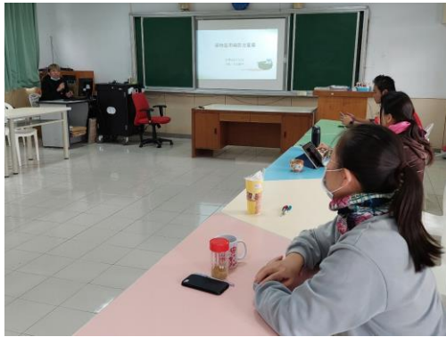
說明：教師藥物濫用防制宣導