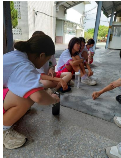
說明：教師進行健康飲水宣導