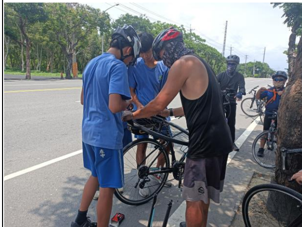
說明：教師進行單車教育