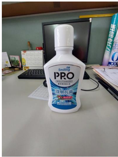
說明：教師飯後刷牙後使用漱口水