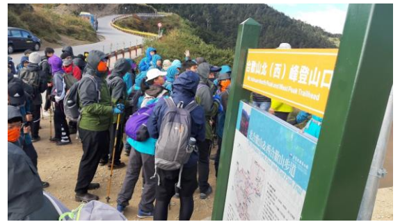
說明：教師進行登山教育