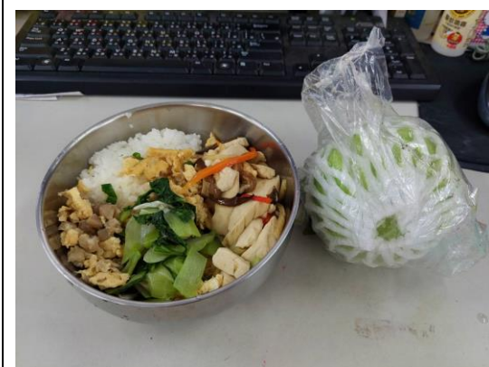
說明：教師營養午餐蔬食健康餐盤 - 多吃蔬果