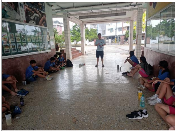
說明：校長進行單車教育