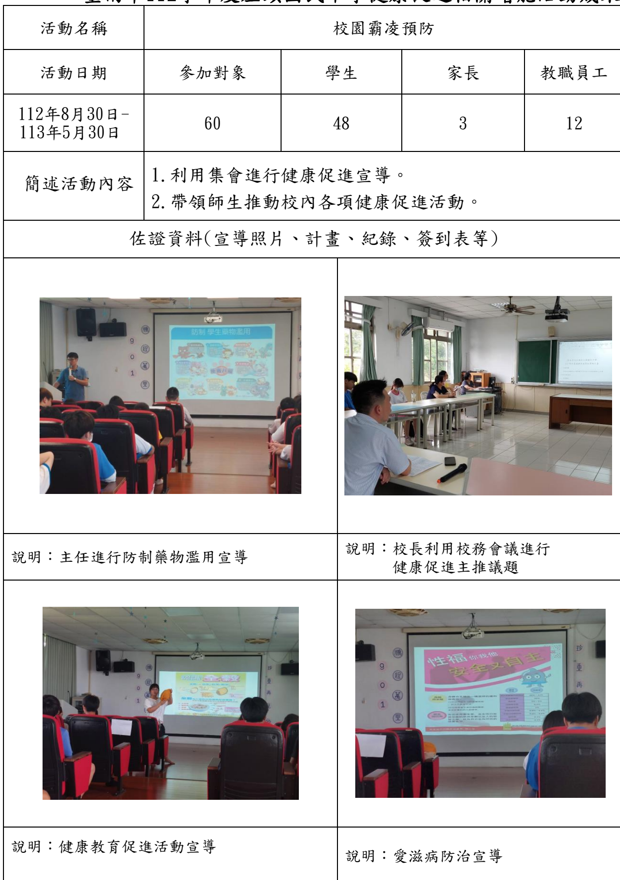
臺南市112學年度左鎮國民中學健康促進相關增能活動成果表