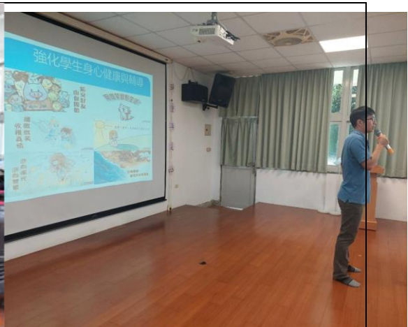
說明：主任進行身心健康強化宣導