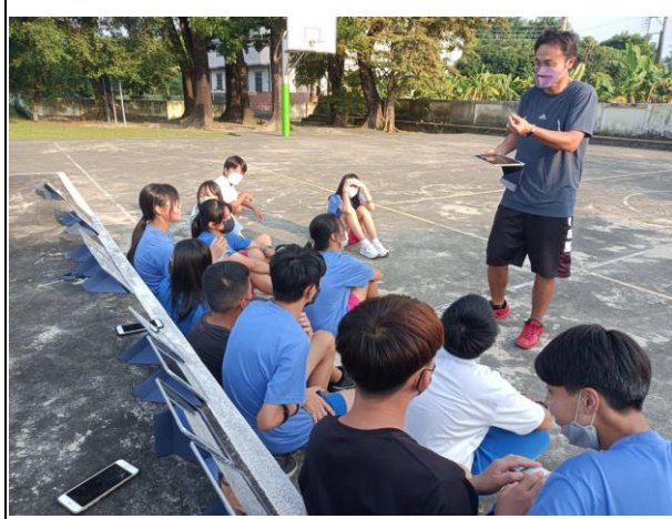
說明：心律表使用操作