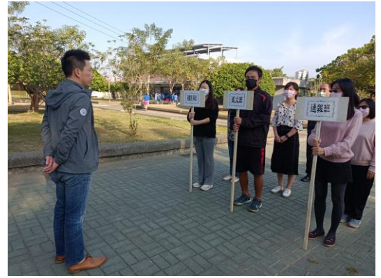
說明：教師消防編組