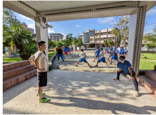
說明：教師橄欖山晨跑前熱身