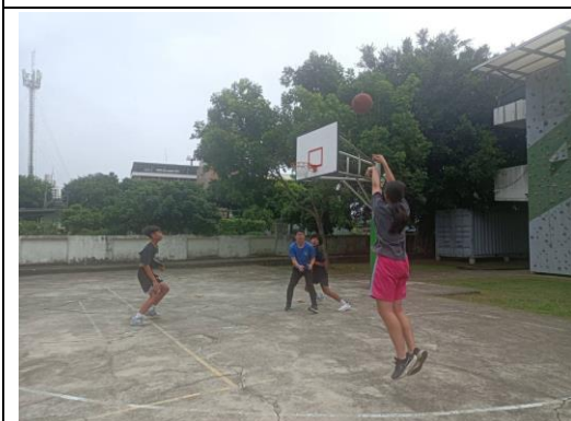
說明：教師課後與學生打球