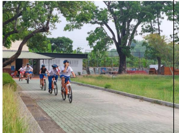
說明：學生進行單車體能活動