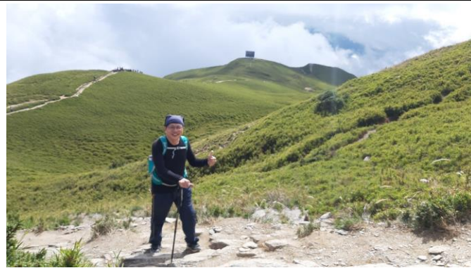
說明：教師進行登山教育