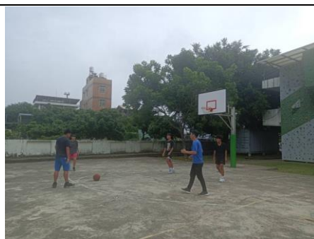
說明：教師課後與學生打球