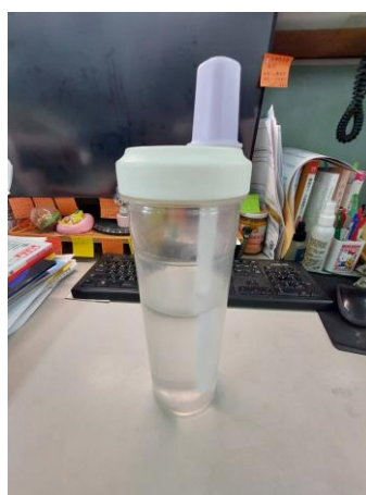
說明：教師每日喝水 1500CC