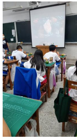
說明：餐前五分鐘一甲