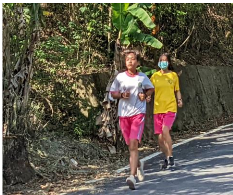
說明：周二橄欖山晨跑