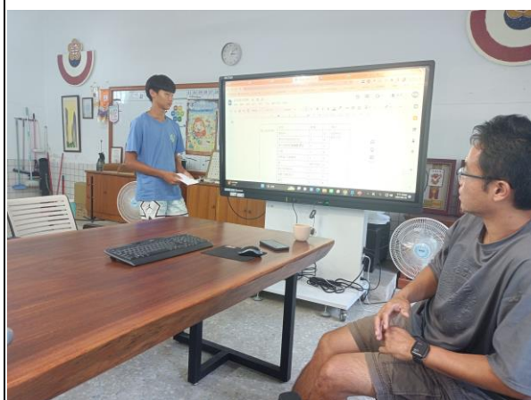
說明： 學生單車教育結合資訊成果分享(校內外人士)