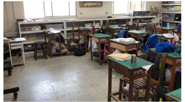
說明：教師與學生進行地震掩護