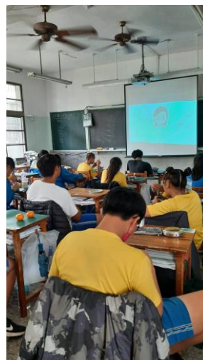
說明：餐前五分鐘三甲