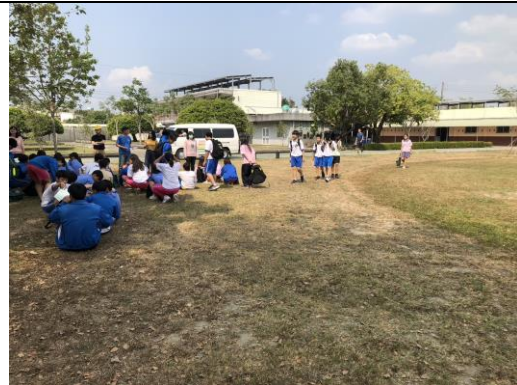
說明：教師引導全校進行防災演練