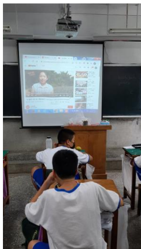
說明：餐前五分鐘二甲