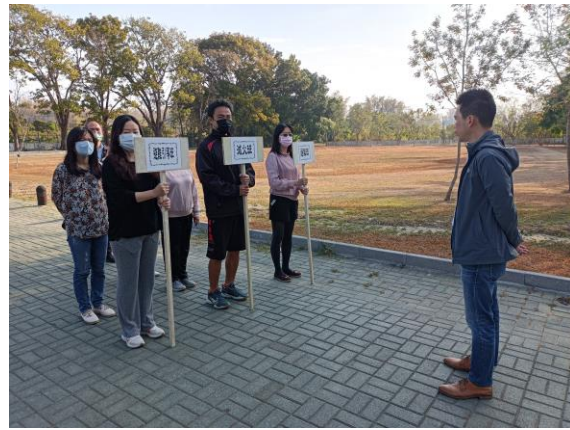
說明：教師消防編組