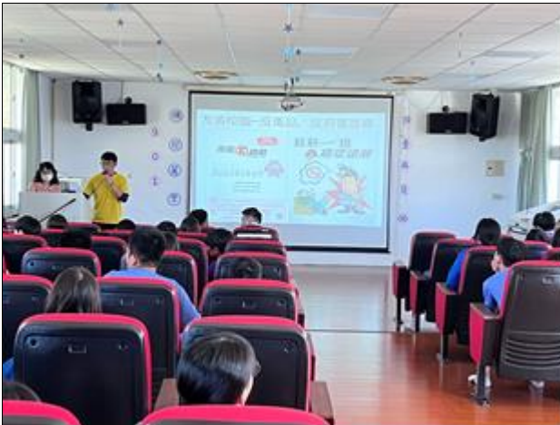
說明：主任進行菸檳宣導