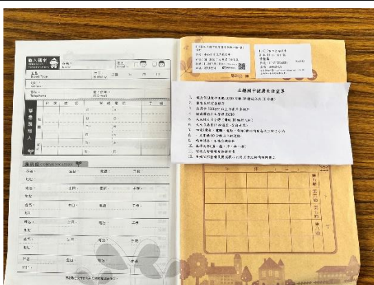
說明：聯絡簿健康資訊一甲