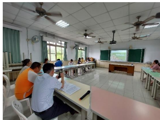
說明：校務會議健康議題－家長代表