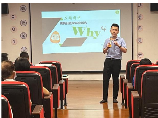
說明：親職日結合健康講座