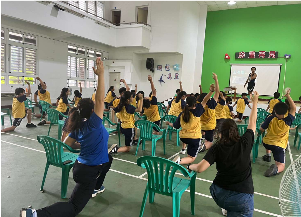
說明：參與規律運動-肌力訓練