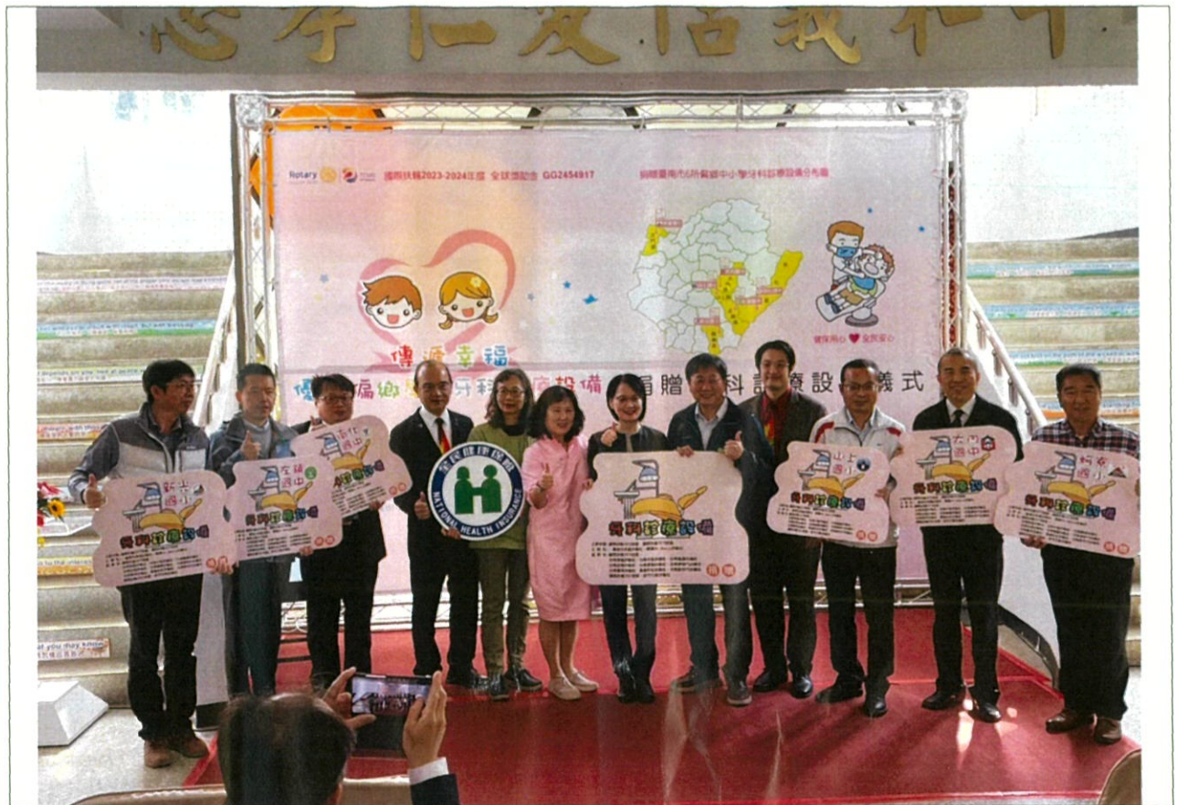
說明：鄰近學校受捐贈牙科診療椅與教育局長、健保署副署長合影