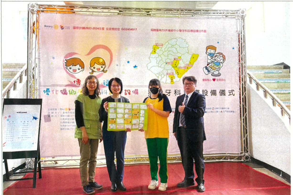
說明：贈送感謝卡片給健保署