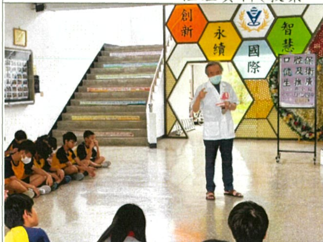
說明：吳醫生指導學生貝氏刷牙