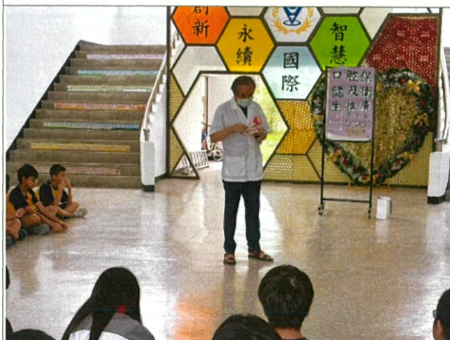
說明：刷牙時的注意事項、小技巧