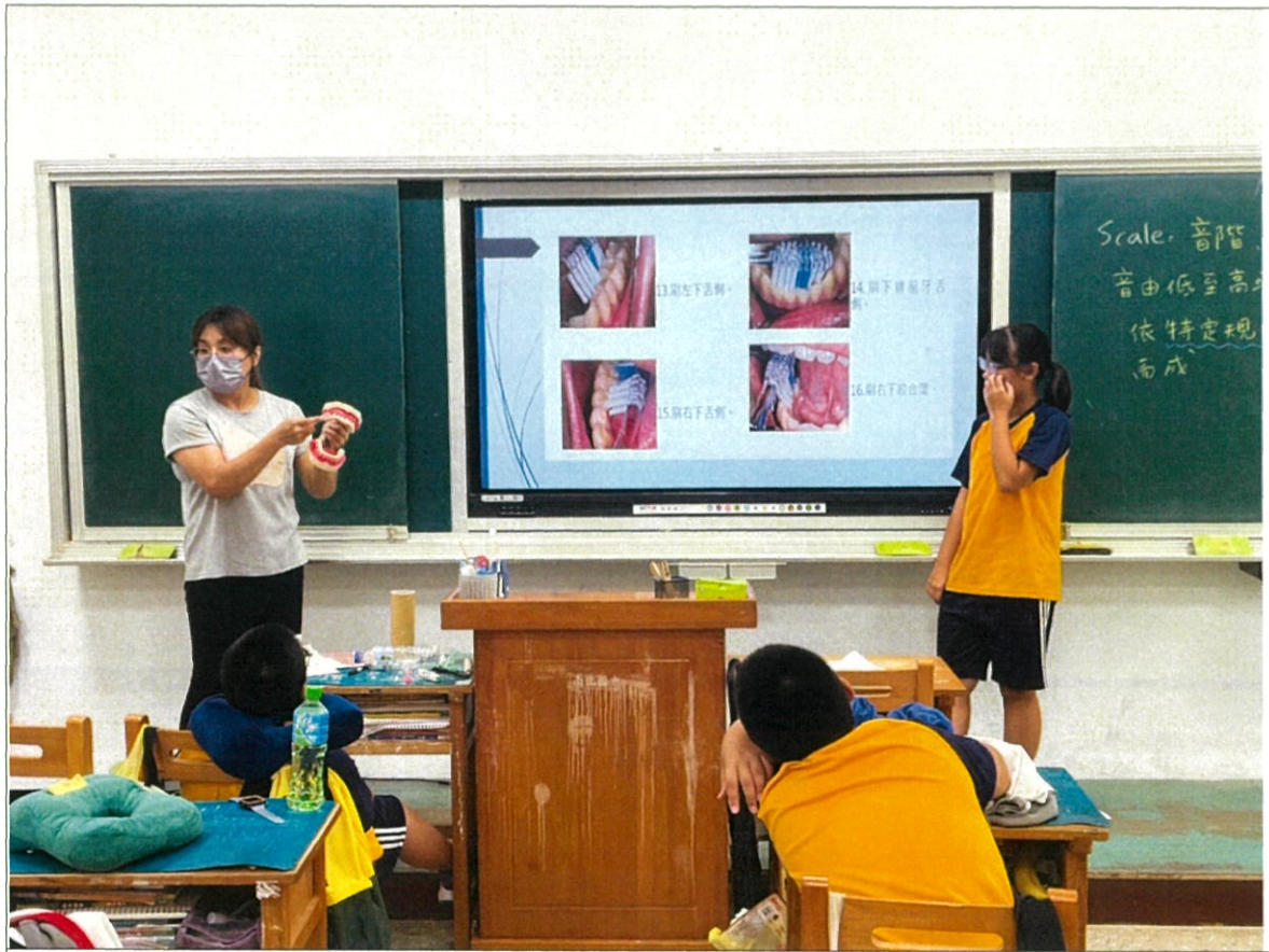
說明：學生製作刷牙簡報，並請護理師協助指導