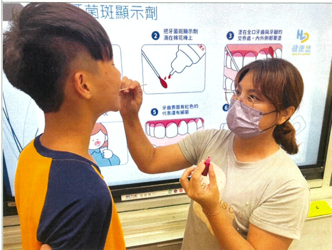
說明：安排使用牙菌斑顯示劑，檢查是否有刷乾淨(詳見3-2-1)