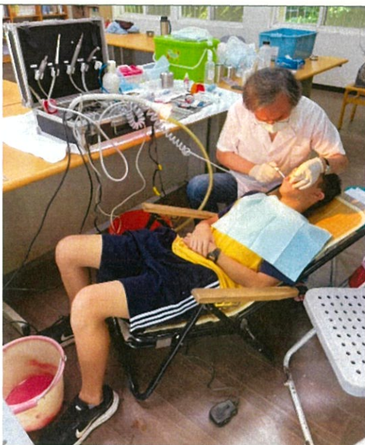
說明：未設立診療前看診實況