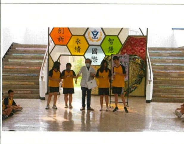
說明：有獎徵答，規律且正確刷牙