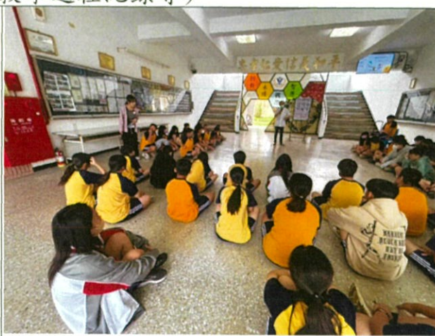
說明：說明為什麼要刷牙