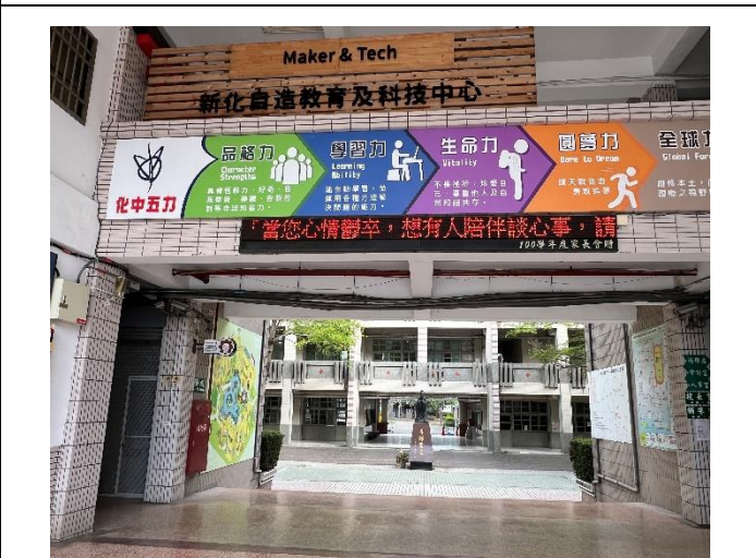
學校電子看板提供健康資訊