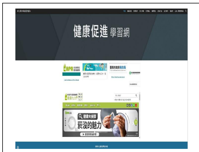
學校健促網站提供健康資訊