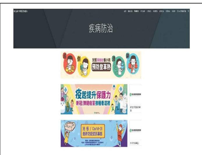
學校健促網站提供健康資訊