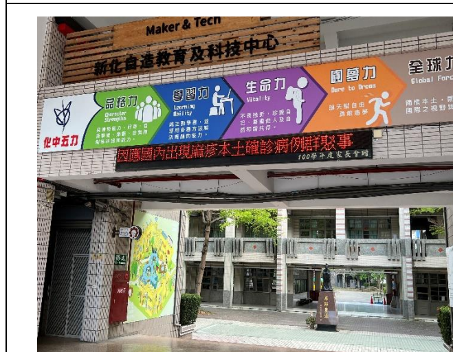
學校電子看板提供健康資訊