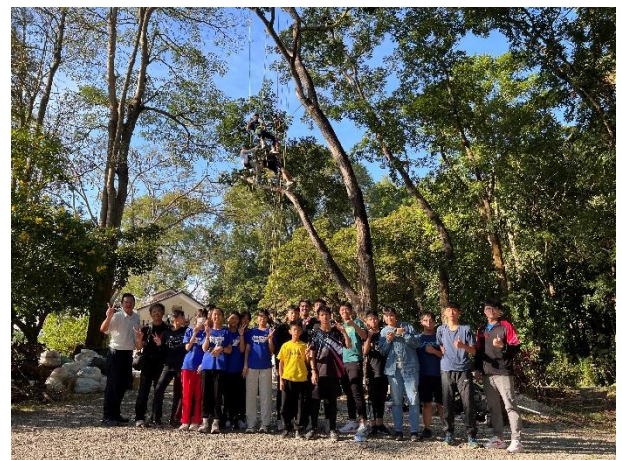
生態教育-林場攀樹