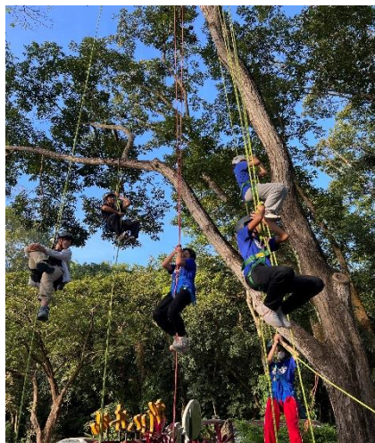
生態教育-林場攀樹