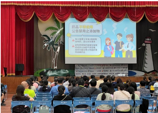
親職教育座談進行健康促進宣導