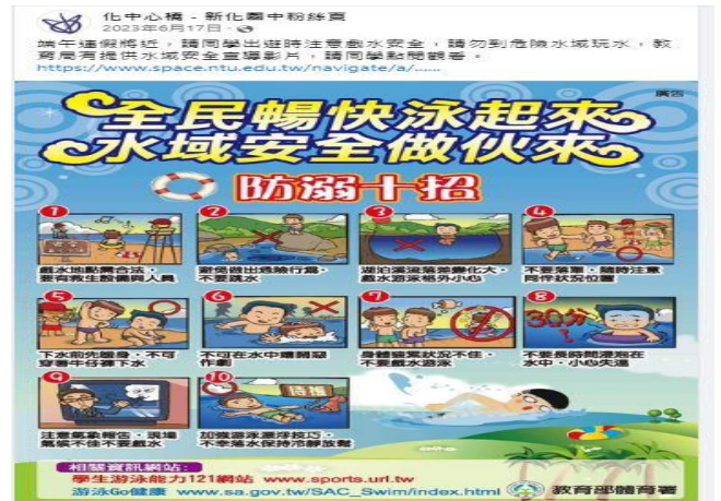
學校 FB 張貼衛教訊息