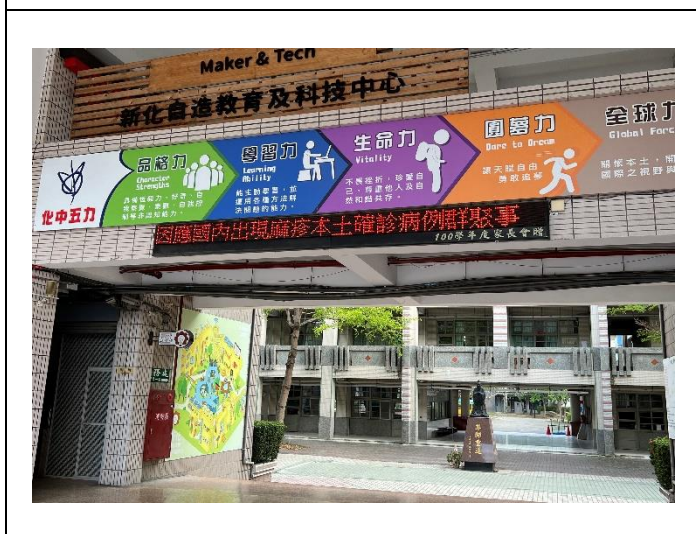
學校電子看板公告衛教訊息