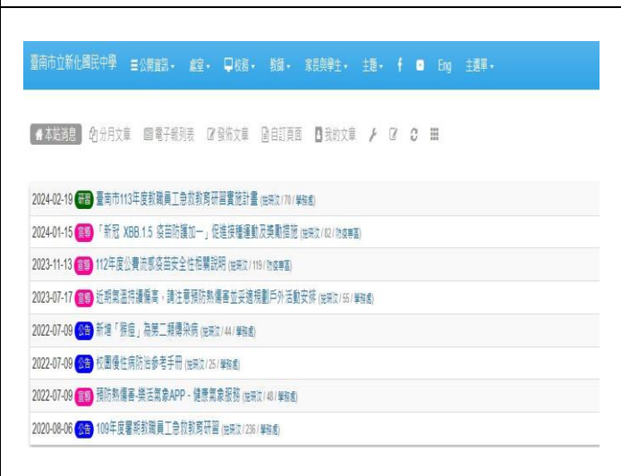
學校網頁張貼衛教訊息