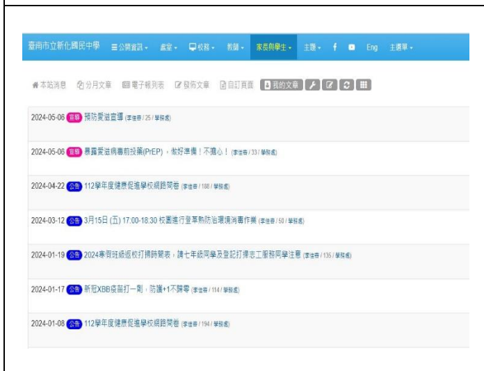
學校網頁張貼衛教訊息