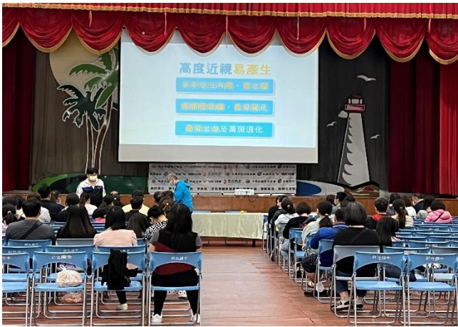
親職教育座談進行健康促進宣導