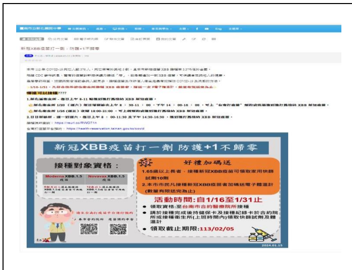
學校網頁張貼衛教訊息