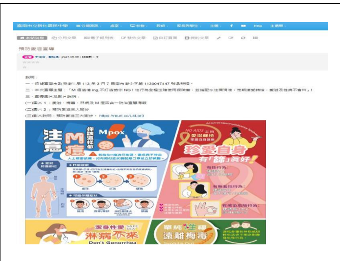
學校網頁張貼衛教訊息