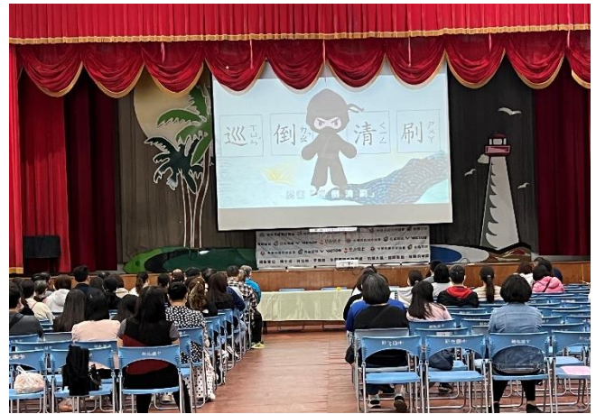
親職教育座談進行健康促進宣導