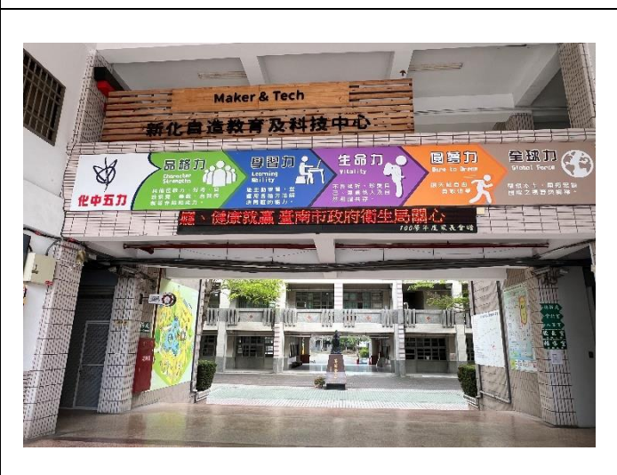
學校電子看板公告衛教訊息