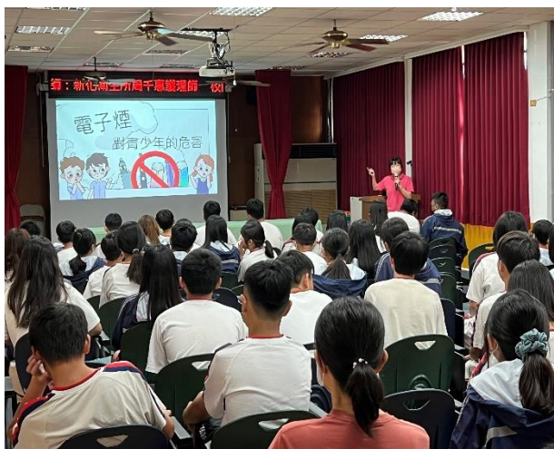
辦理菸檳防治宣導講座