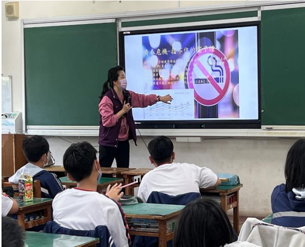
辦理菸檳防治入班宣導