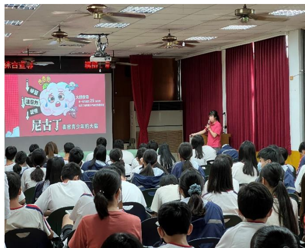
辦理菸檳防治宣導講座