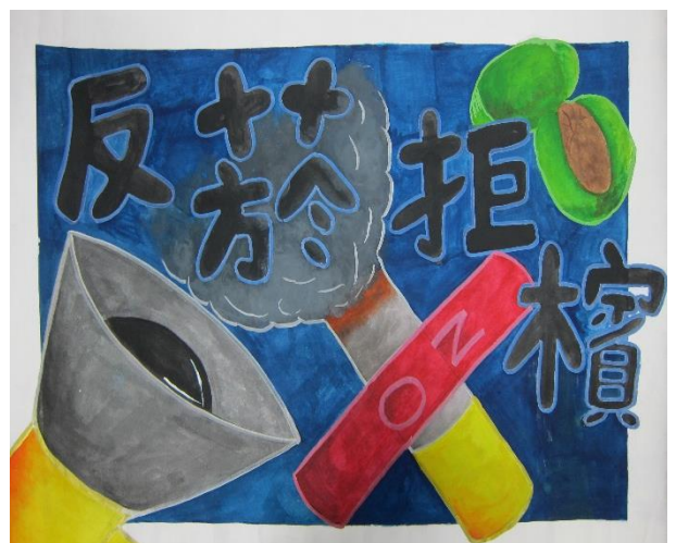
辦理菸檳防治藝文比賽