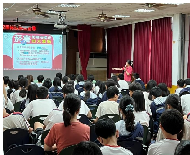
辦理菸檳防治宣導講座