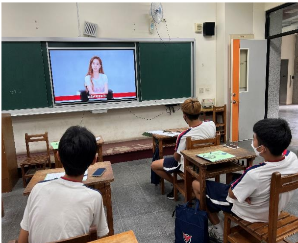
辦理戒菸教育班-觀看戒菸影片