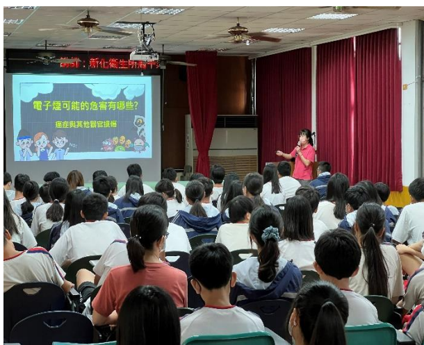
辦理菸檳防治宣導講座