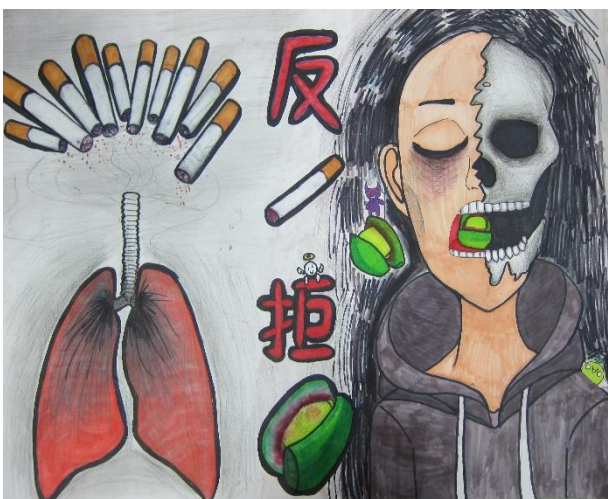
辦理菸檳防治藝文比賽