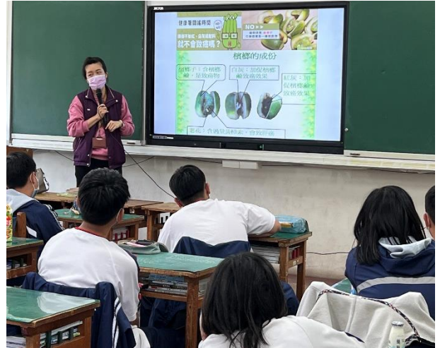
辦理菸檳防治入班宣導