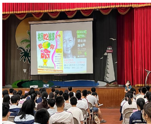
辦理菸檳防治宣導講座