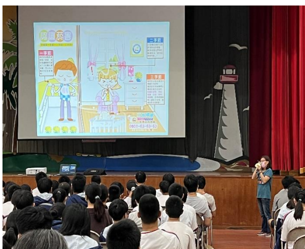
辦理菸檳防治宣導講座