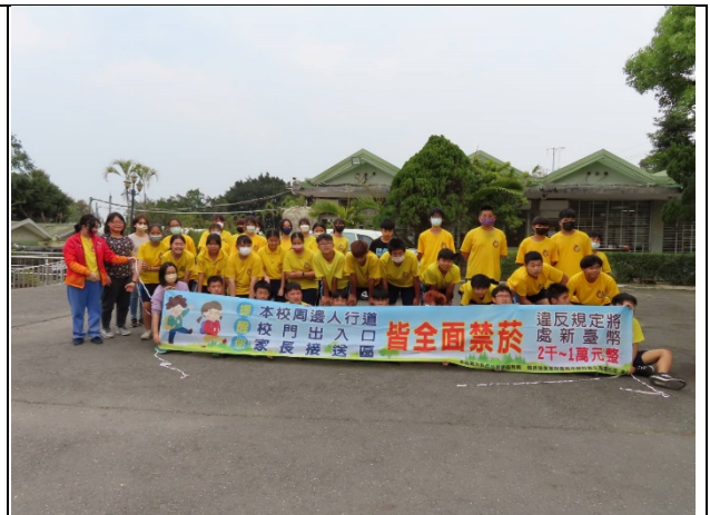
說明：衛所健康體適能-越野賽跑