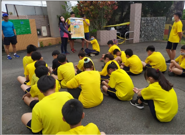
說明：衛所健康促進宣導