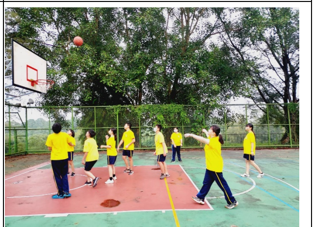
說明：普及化運動-晨間體能活動