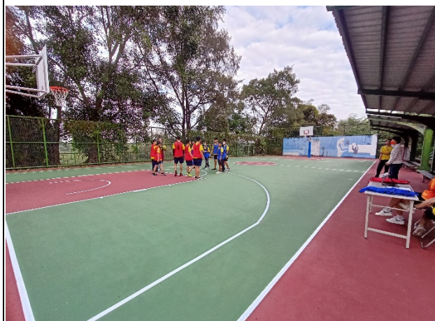
說明：健康體適能-籃球比賽