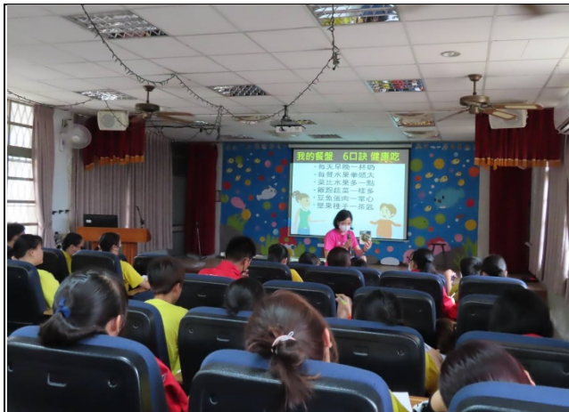
說明：衛所健康餐盤宣導