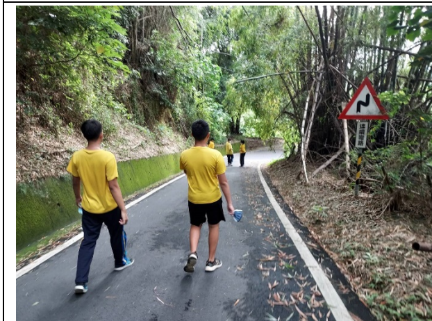
說明：普及化運動-晨間體能活動