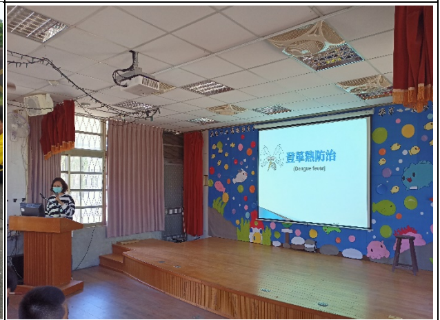
說明：衛所登革熱防疫宣導