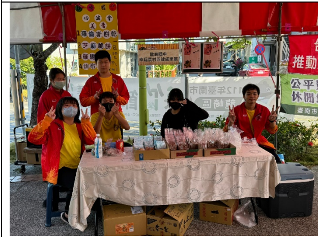
說明：農會健康飲食義賣活動