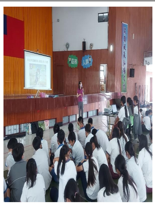
衛生所護理師入校宣導健康促進