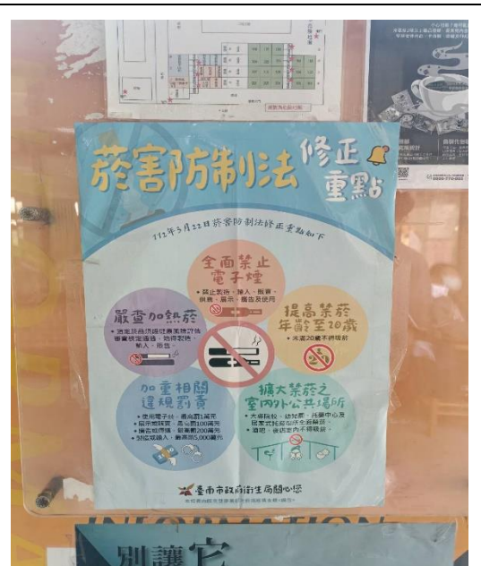
學校公佈欄張貼拒菸宣導