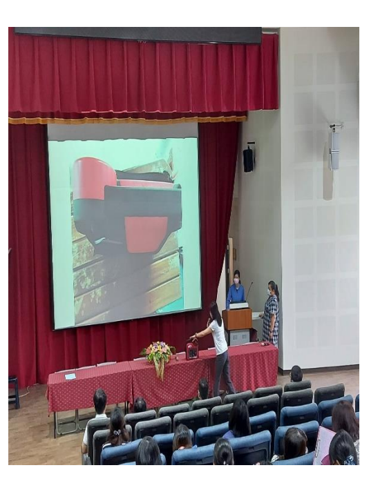
校內護理師提供簡易傷病處理、AED 使用教學