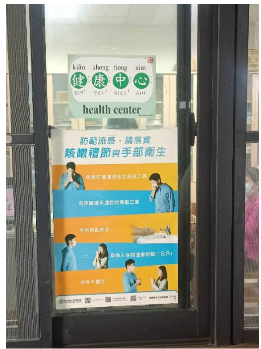
健康中心外張貼健康醫療相關資訊