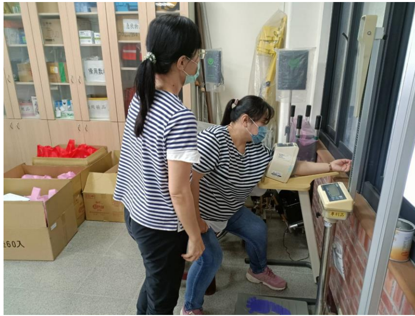
老師至健康中心做健康諮詢