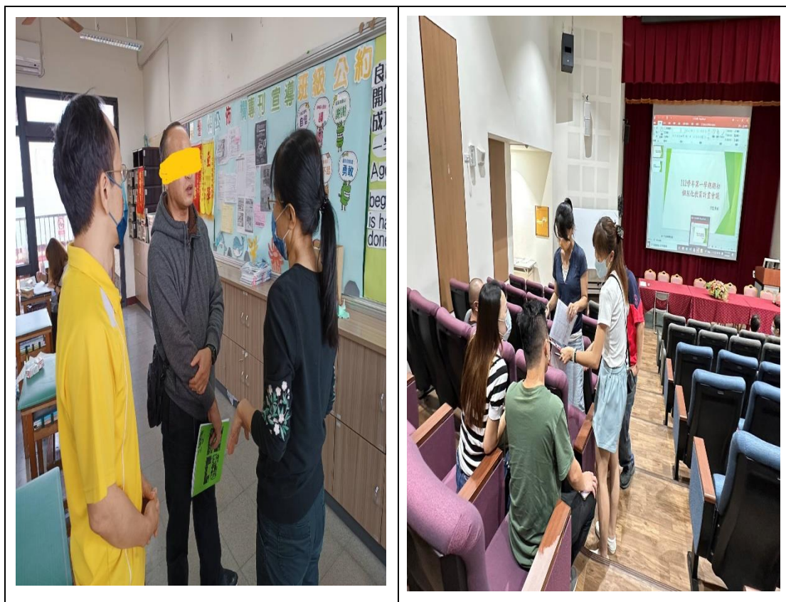
護理師及導師與家長溝通學生健康追蹤矯治情況