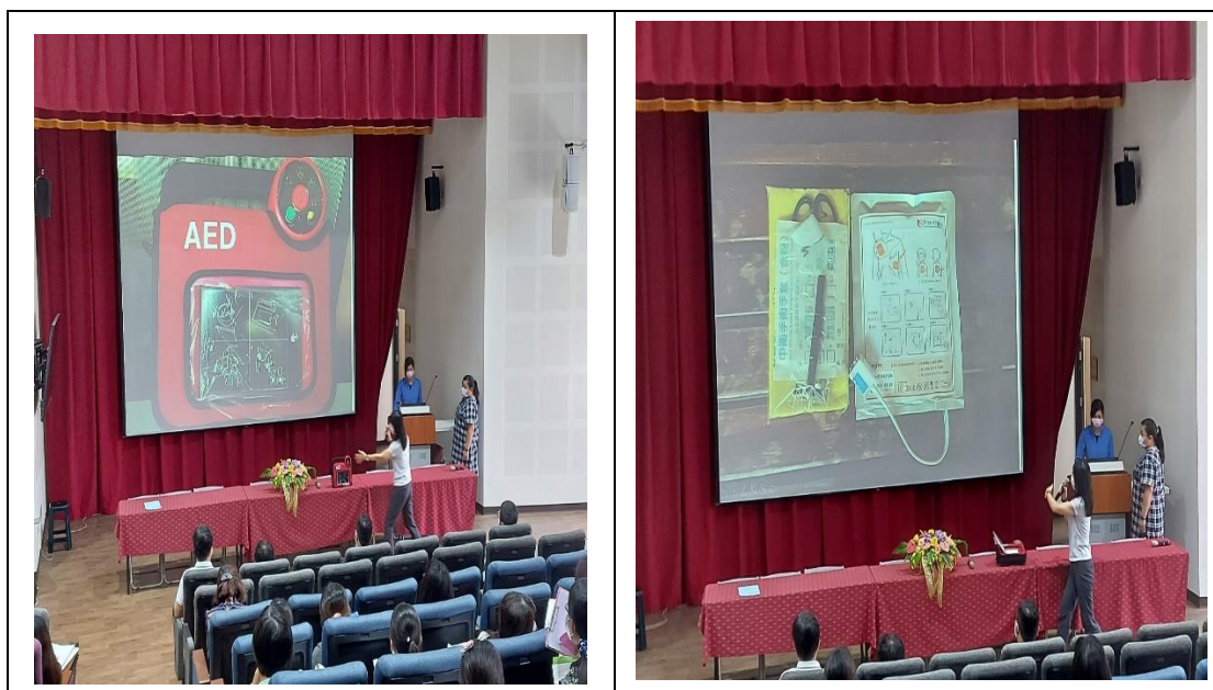
護理師指導教職員工 AED 的使用方式。