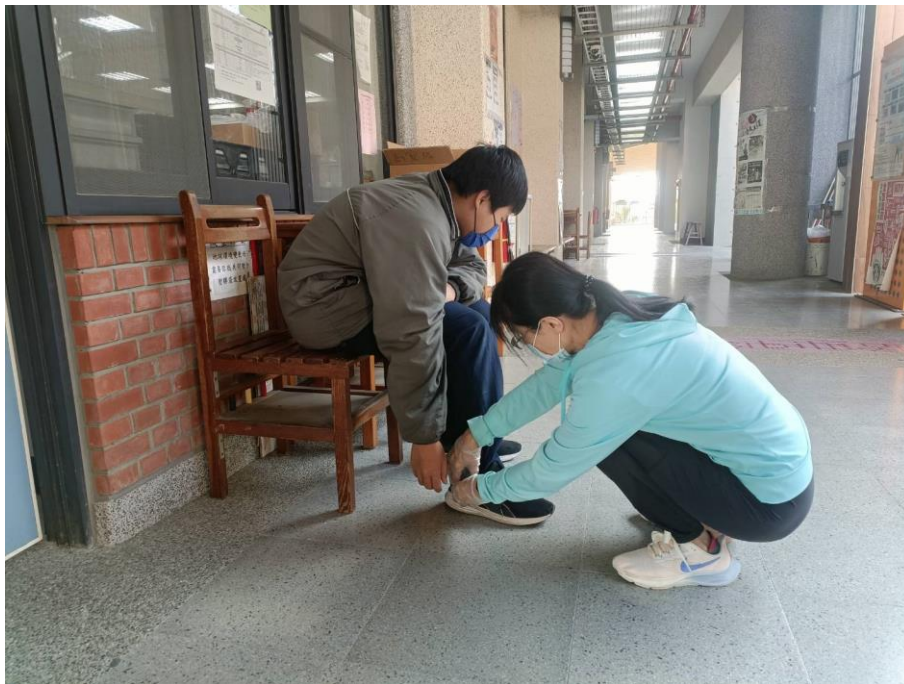
學生放學時扭傷護理師協助處理