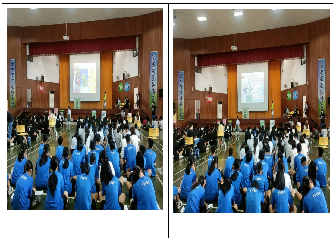
學期初、學期末辦理健康宣導