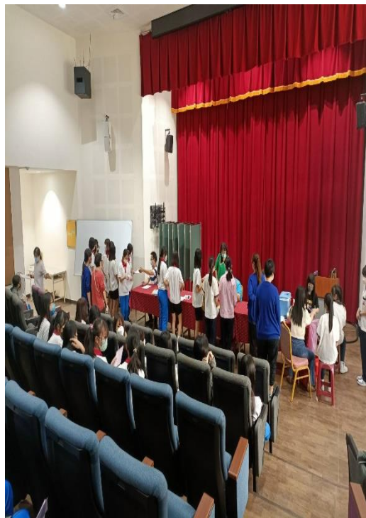
與衛生所配合辦理 HPV 疫苗接種