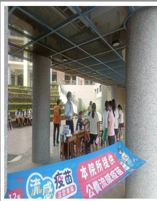
與吉安醫院配合辦理流感疫苗接種