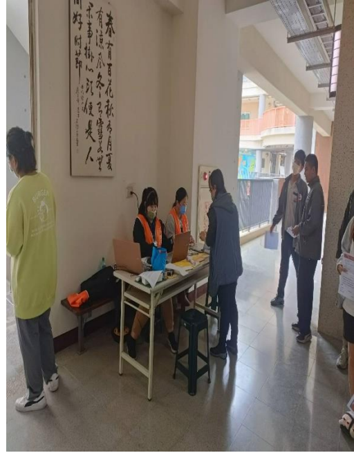
與吉安醫院配合辦理莫德納 XBB. 1. 5 疫苗接種