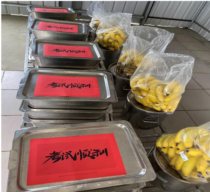
午餐用餐佈置加油單為考生加油