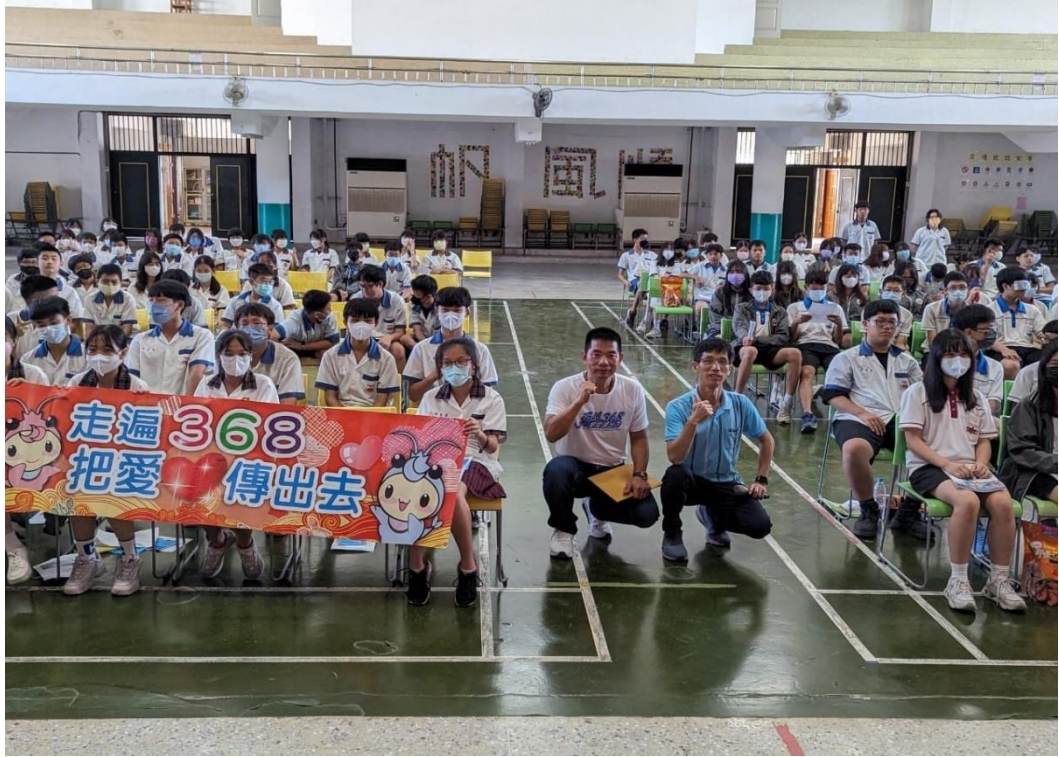
邀請業界入校宣導