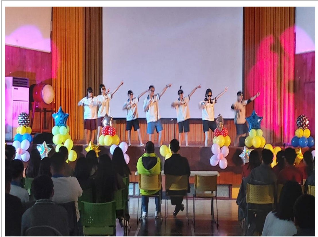
辦理全校同樂會活動