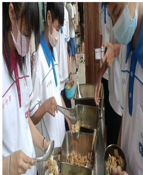
營養午餐-食用在地食材並廣播宣導綠色消費