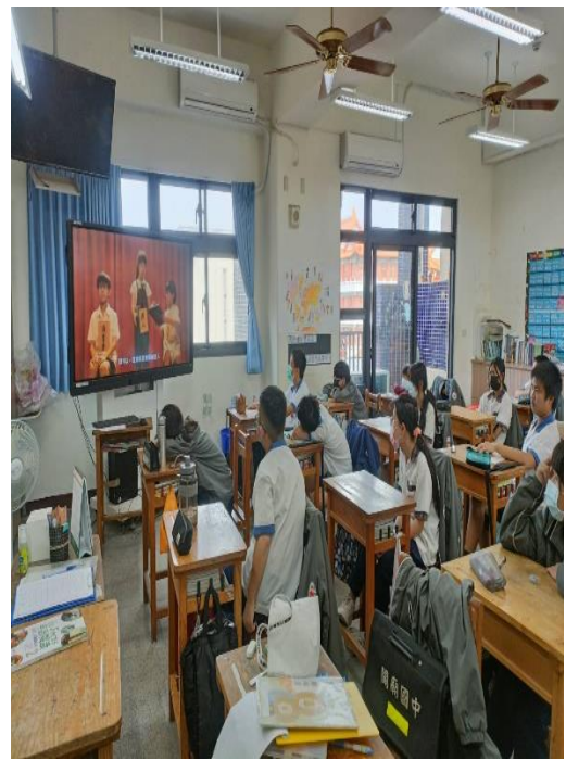
健教課程-海洋教育