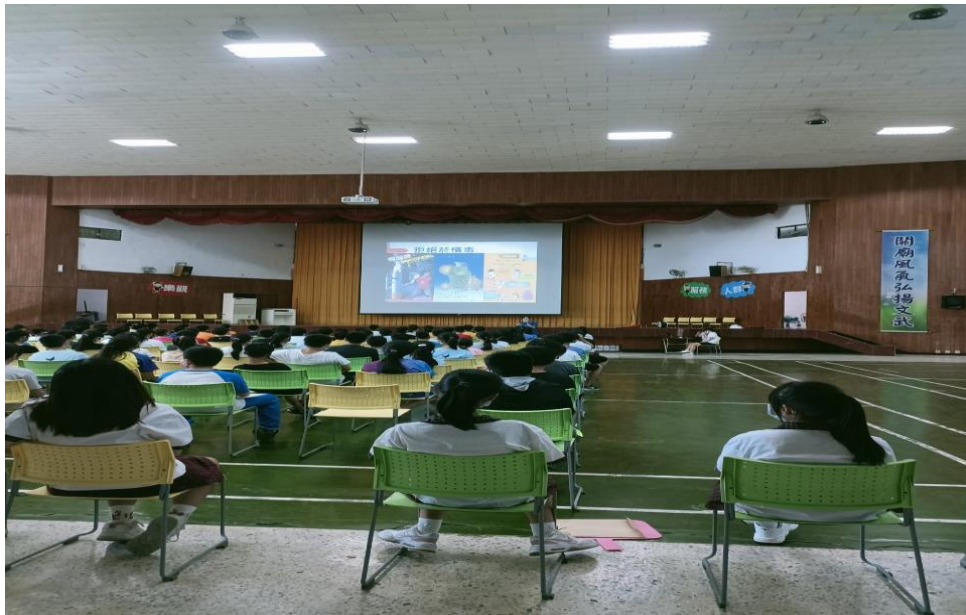
於學期初對新生宣導拒絕檳榔保持口腔衛生