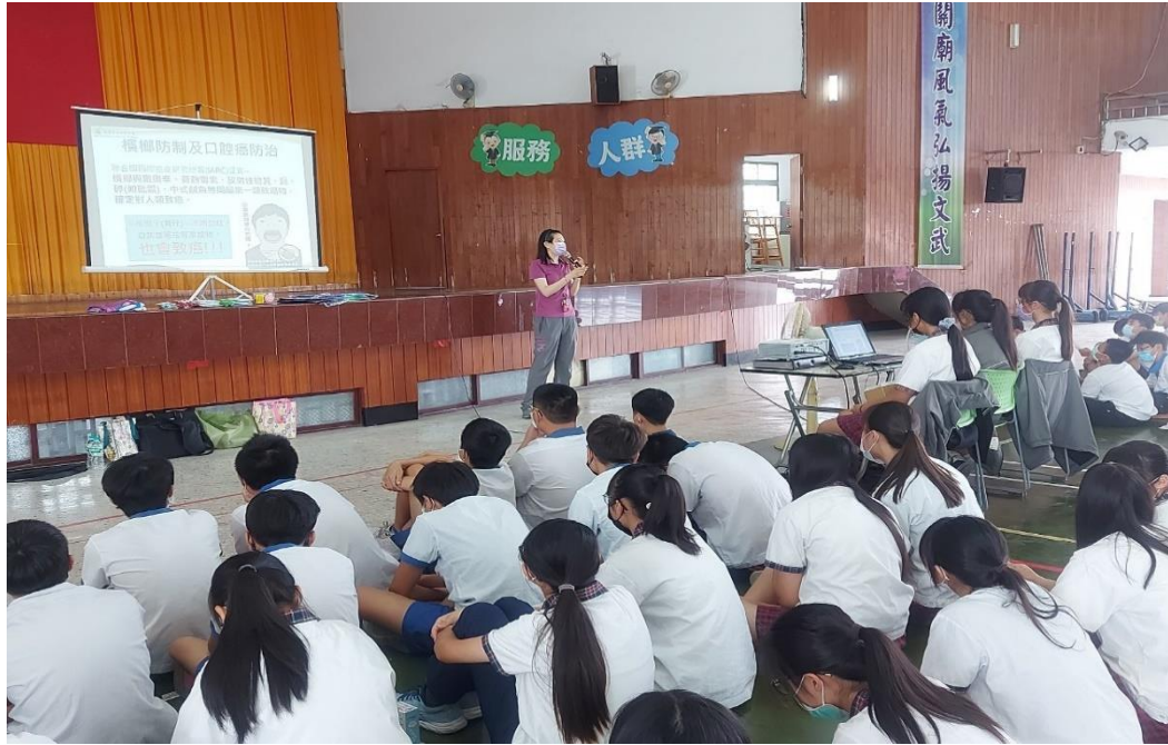
邀請衛生所衛理師入校宣導健康促進相關議題