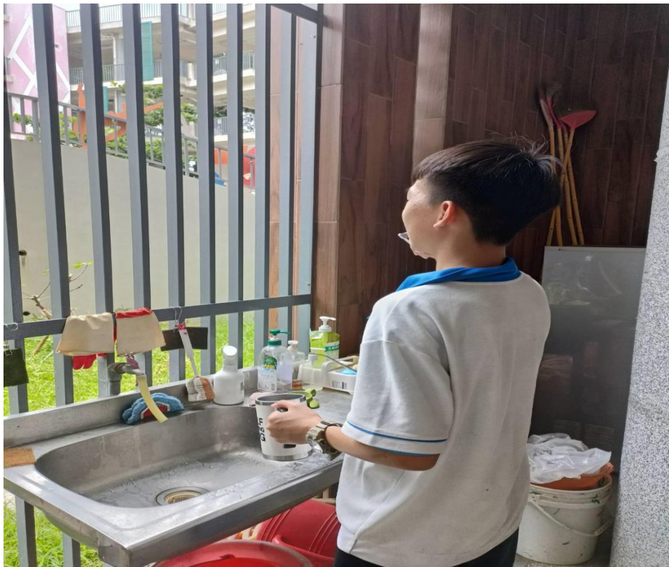
學生午餐過後潔牙