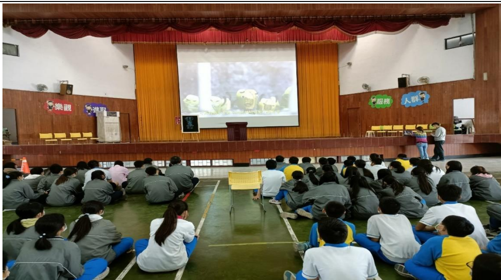
學期末宣導拒絕檳榔保持口腔衛生