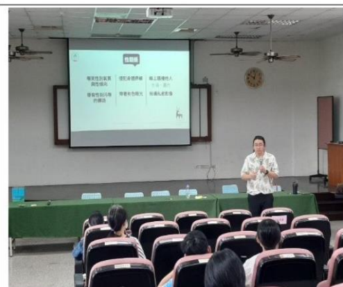
說明性騷擾的樣態