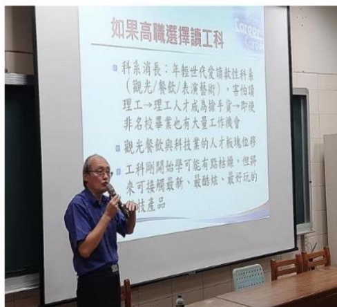
分享孩子高職選擇工科的未來發展