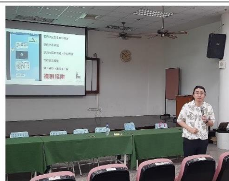
說明孩子在網路裸聊的危險性