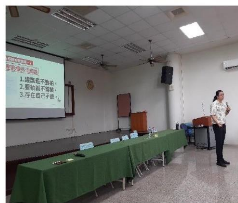
說明私密影像外流的處理策略