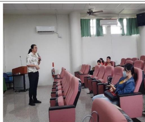
傳心理師說明青少年心理及生理發展的特徵