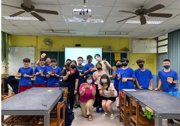
說明：百萬木工---永興木工