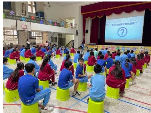
說明：海洋教育-國家公園宣導人員