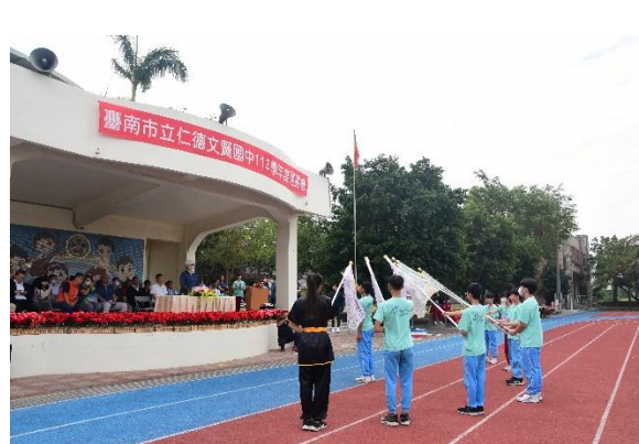
說明：112年運動會各友邦校長及地方人士