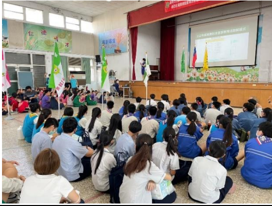
說明：112女童軍大會---女童軍會長