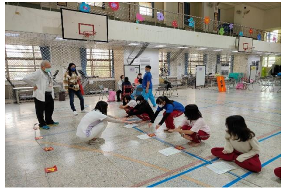
說明：7年級健康檢查