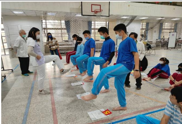
說明：7年級健康檢查