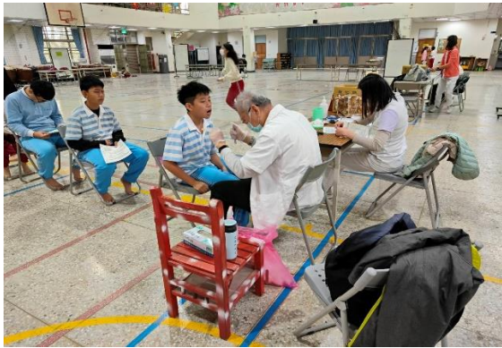
說明：7年級健康檢查