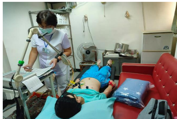
說明：7年級健康檢查