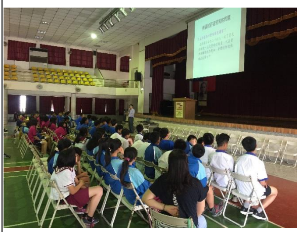
說明：張醫師說明吸菸者常見問題