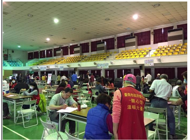
說明：本校家長及社區民眾踴躍參與