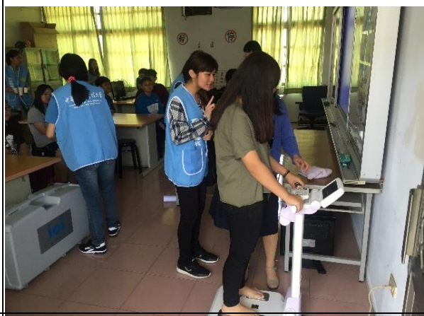
說明：學生進行體重前測