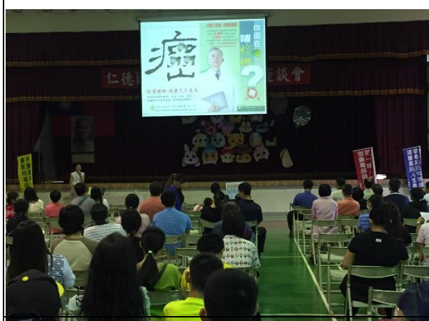
說明：講解菸檳與口腔觀念