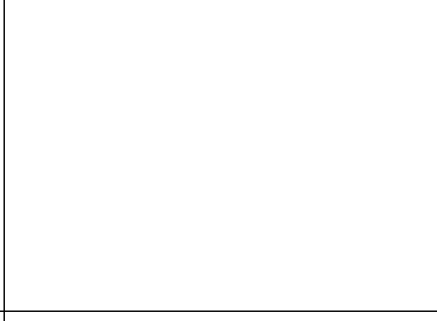
說明：行動醫院注意事項