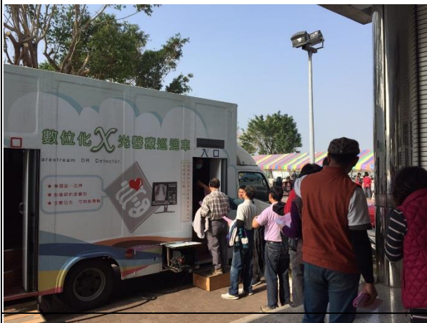
說明：本校家長及社區民眾踴躍參與