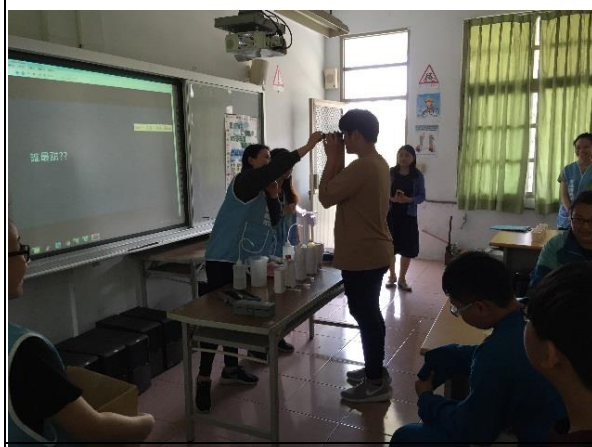
說明：學生實際操作，了解含糖飲料的甜度