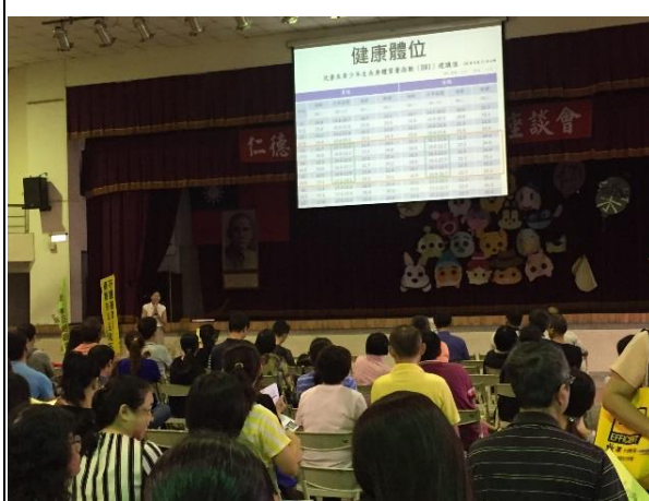
說明：講解健康體位 BMI 觀念