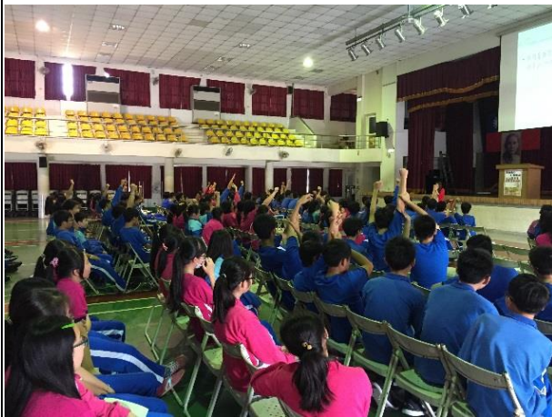
說明：問答活動學生反應熱烈