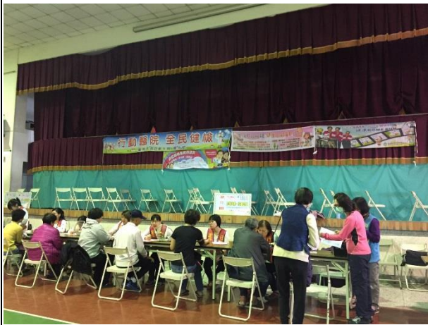
說明：本校家長及社區民眾踴躍參與