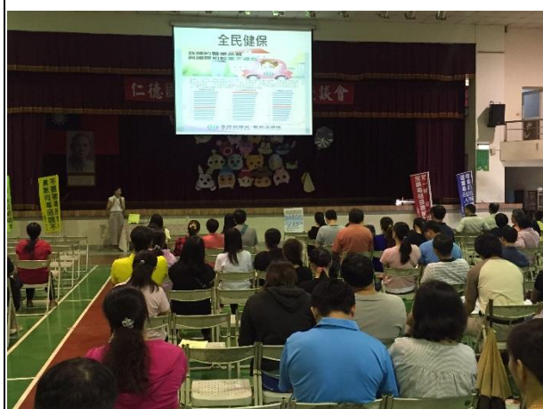
說明：健康促進對社區民眾及家長健康宣導