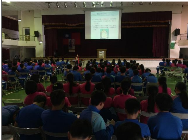
說明：學生們專心聆聽王老師的講解