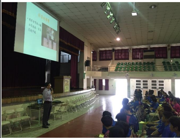
說明：張醫師說明菸所造成的事實