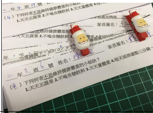
說明：親子一同關注健康議題才可抽獎