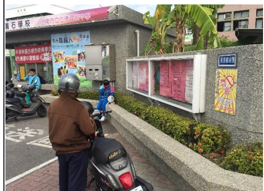
說明：家長接送區張貼禁菸告示牌