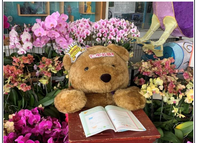
說明：校園環境布置