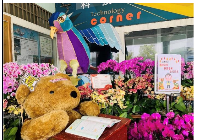
說明：校園環境布置