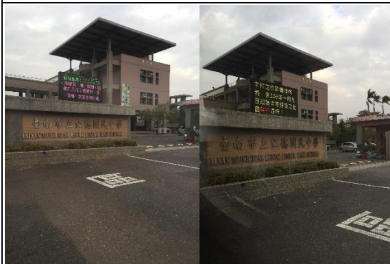
說明：電子看板24小時宣導戒菸、檳、酒、毒