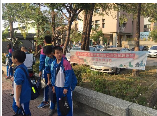
說明：家長接送區懸掛禁菸布條