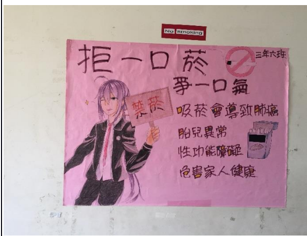
說明：菸癮防治概念融入班級布置