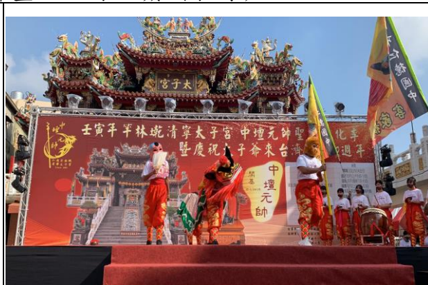
說明：客家獅進行健康活動宣導