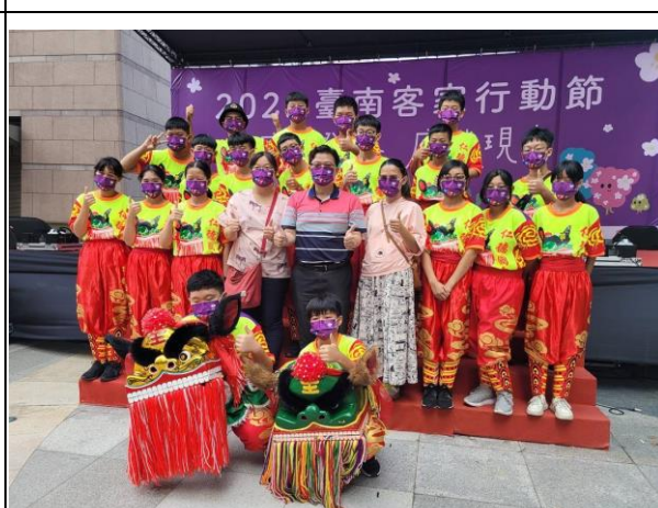
說明：校長帶領客家獅進行社區健康活動