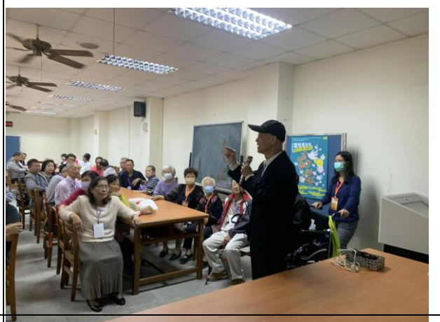
說明：健康體位宣導