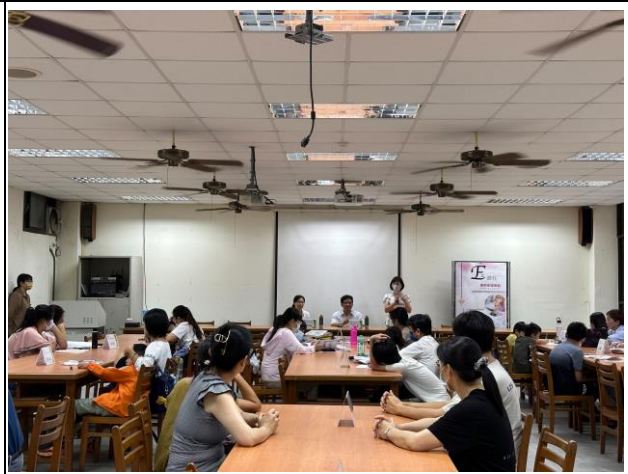
說明： 健康飲食宣導