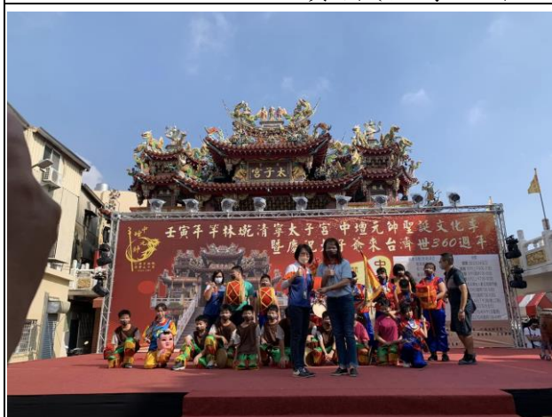
說明：校長帶領客家獅進行健康活動宣導