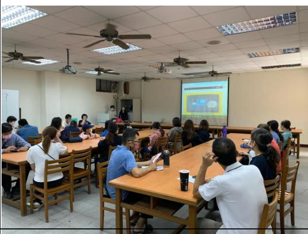
說明： 健康體位宣導