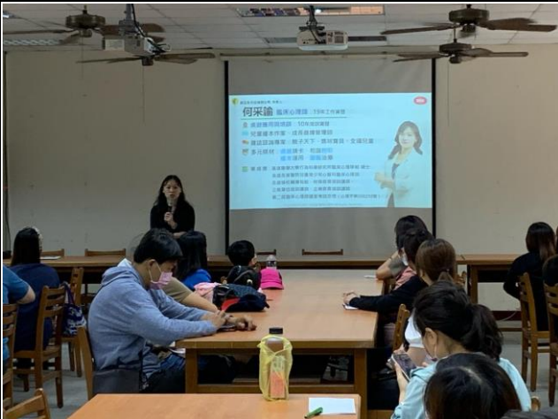
說明： 正向心理宣導