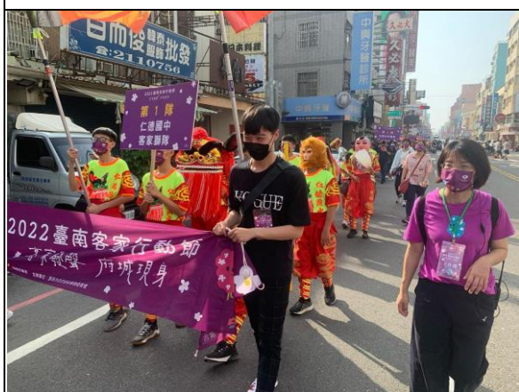
說明：客家獅進行健走宣傳活動