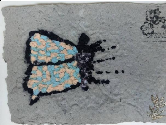
說明：走讀廣護宮活動-作品創作3