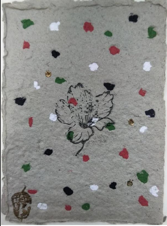
說明：走讀廣護宮活動-作品創作1