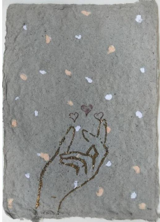
說明：走讀廣護宮活動-作品創作2