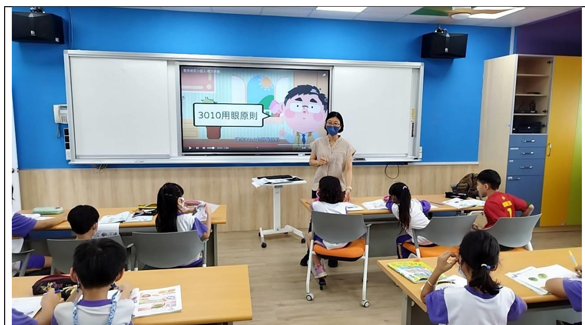
班級老師視力保健宣導說明