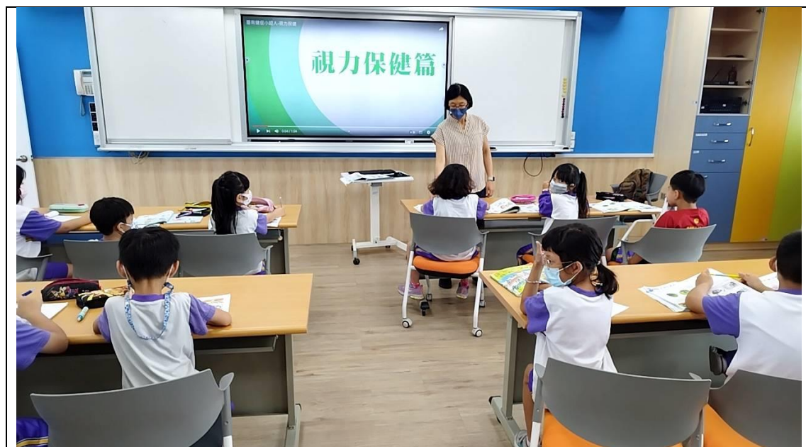
班級老師視力保健宣導說明