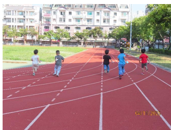
幼兒園參加學校運動小英雄的活動，每天運動30分鐘。