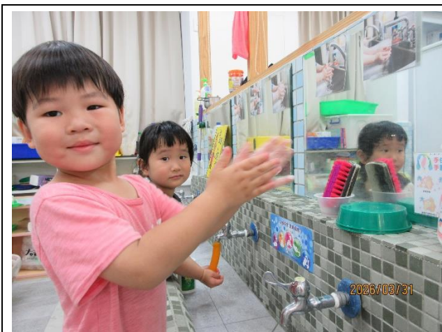
教導學生正確洗手技巧，培養學生勤洗手的好習慣。