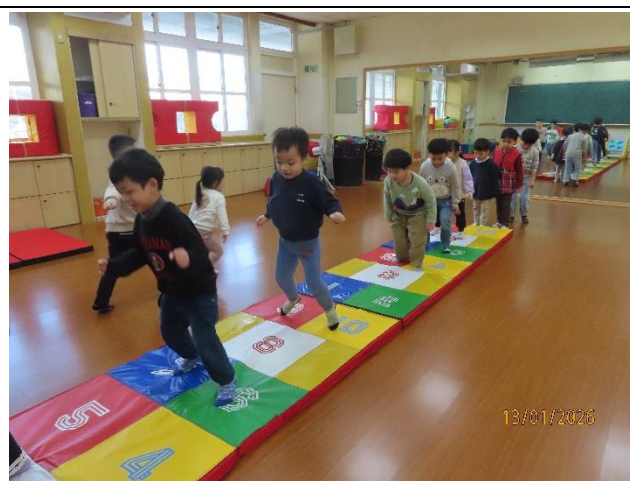
雨天時在室內進行體育活動。