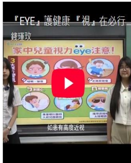
114學年度校園健康主播- eye護視力 視在必行