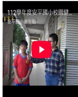
112學年度校園健康主播- 用眼新生活愛我睛健康