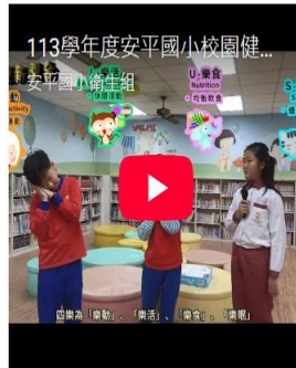
113學年度校園健康主播- 五正四樂 幸福快樂