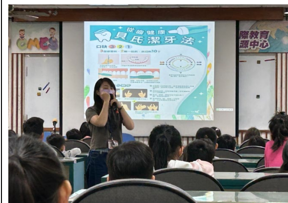
邀請衛生所護理師辦理口腔保健宣導