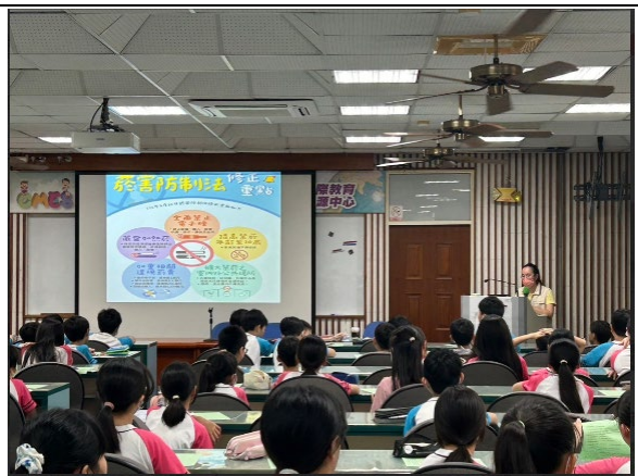
邀請衛生所護理師辦理菸癮性教育宣導