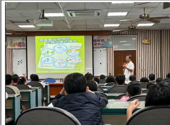
邀請社區藥師辦理用藥安全講座