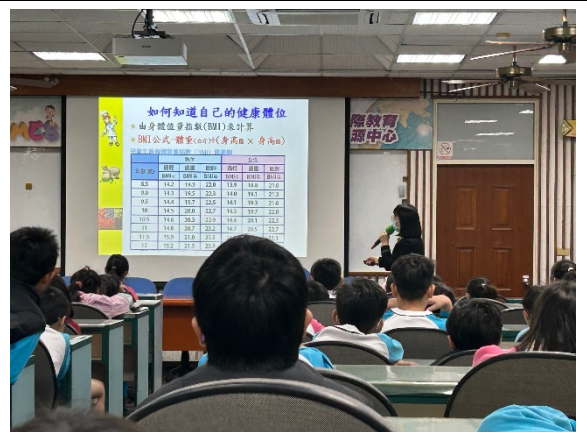
邀請市立醫院辦理健康體位講座