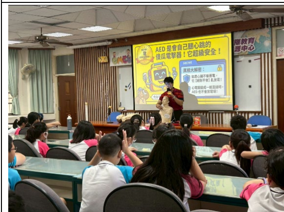
邀請消防局教官辦理安全急救 CPR 講座