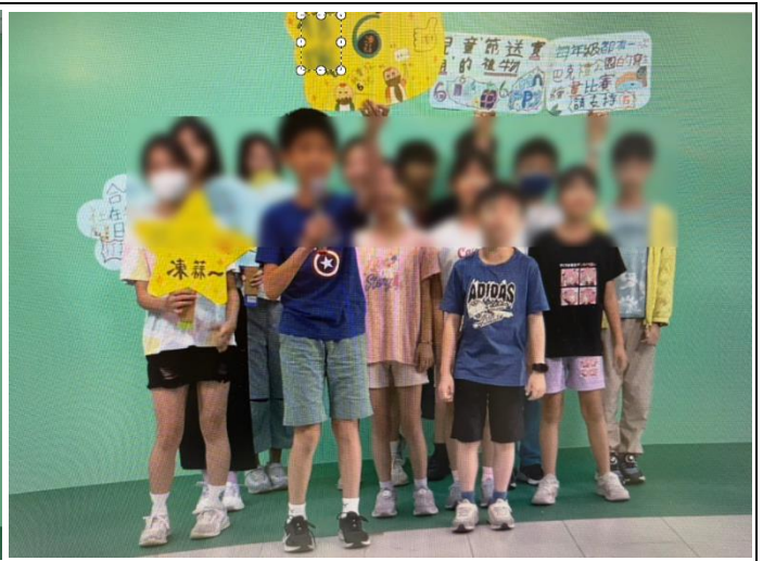
自治市小市長政見發表直播現場