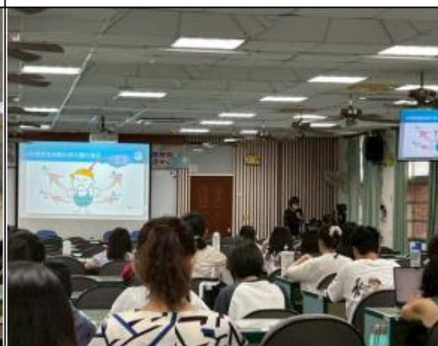
如何改善人際與團隊關係