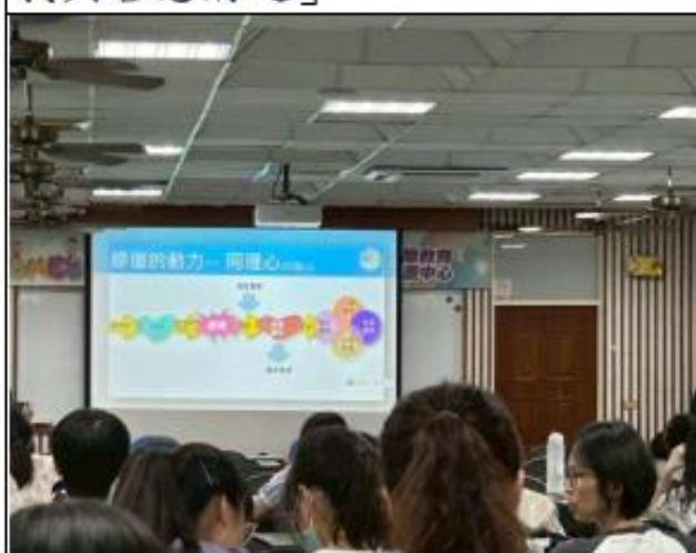
「修復的動力-同理心」說明