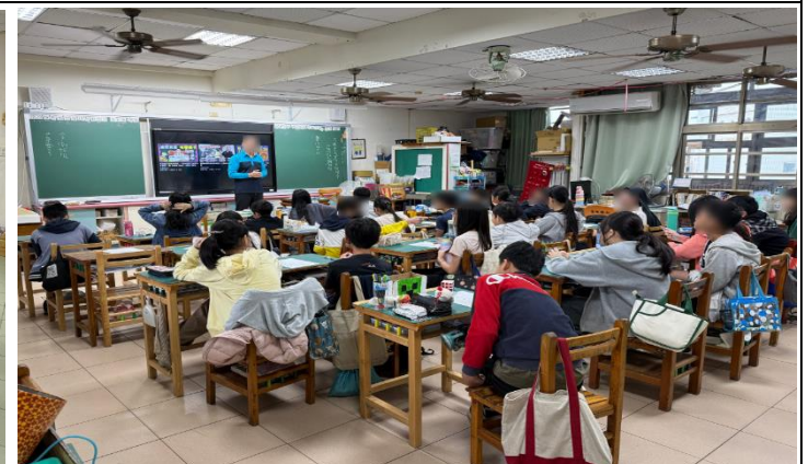
教師進行宣導性平教育