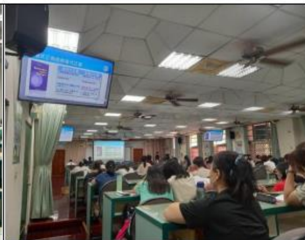
「修復式正義與應報式正義」之差別