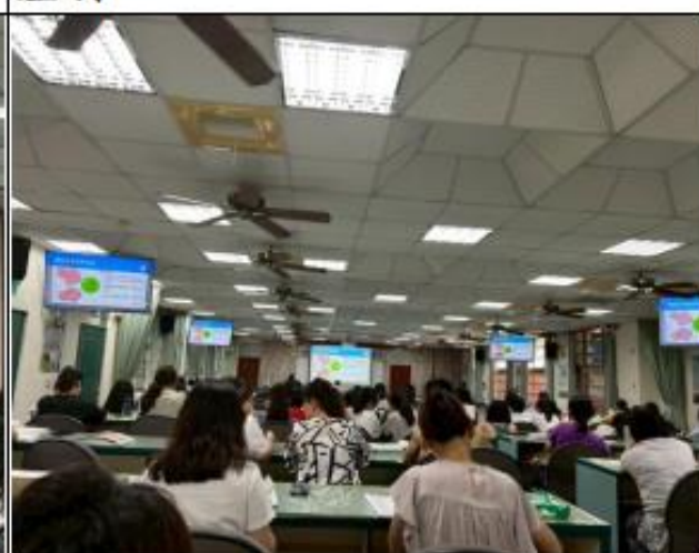
「傳統法治教育思維」說明