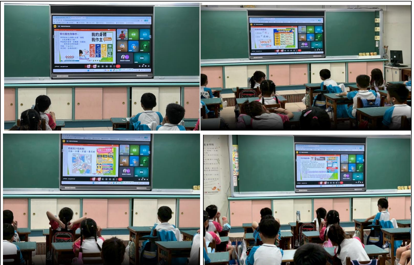
利用學生朝會反性侵、反性騷擾、反性霸凌、反校園霸凌宣導