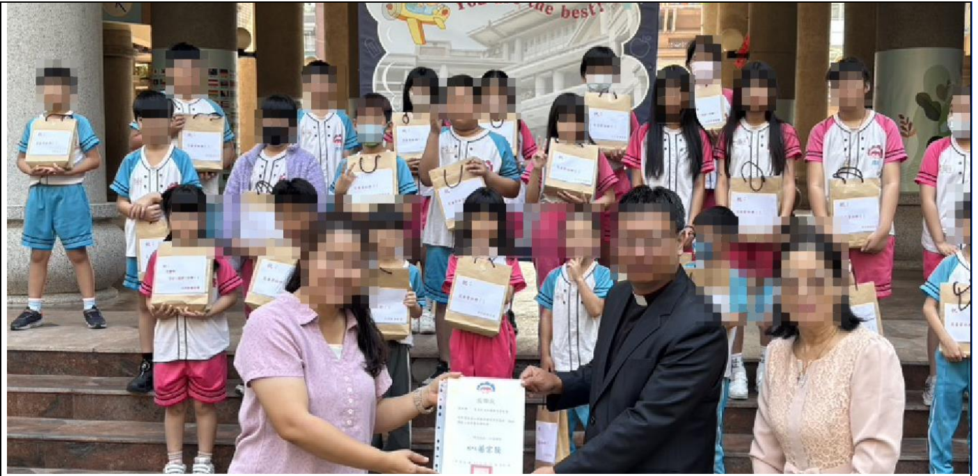
與大同教會共同為弱勢兒童發兒童節禮物，關懷學生讓孩子有個快樂的兒童節