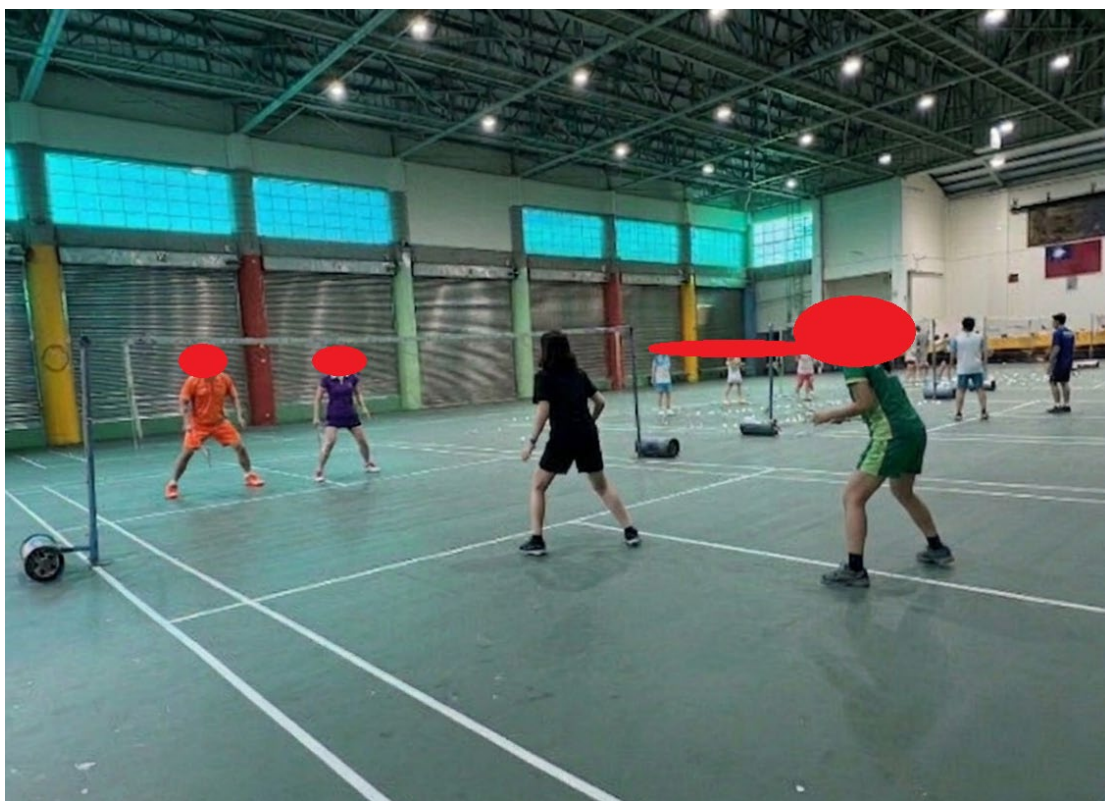
三、教師運動完後喝足白開水