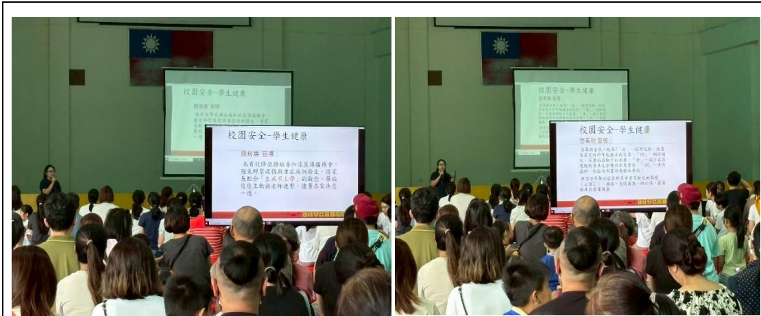
利用全校班親會，向家長宣導健康訊息。