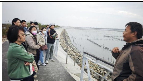
圖 2：在地講師說明蘆竹溝沿海生態與漁村產業特色。