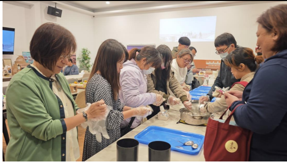
圖 5：虱目魚丸實作體驗：教師動手做、體會從產地到餐桌。