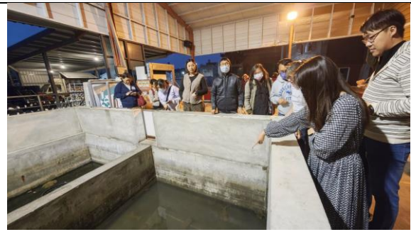
圖 8：養殖場參訪：認識養殖工法及一生。