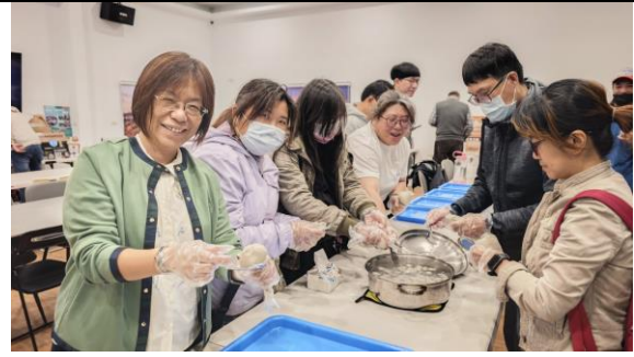
圖 6：教師專注捏製虱目魚丸，體驗在地飲食文化。