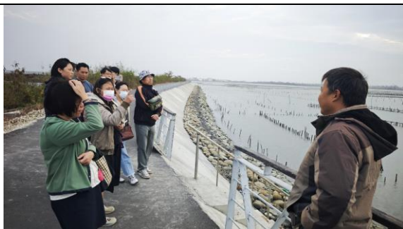
圖 1：蘆竹溝海堤生態走讀：認識牡蠣養殖與潟湖地景。