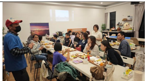
圖 10：在地食材風味餐及綜合座談：教師交流與回饋分享。