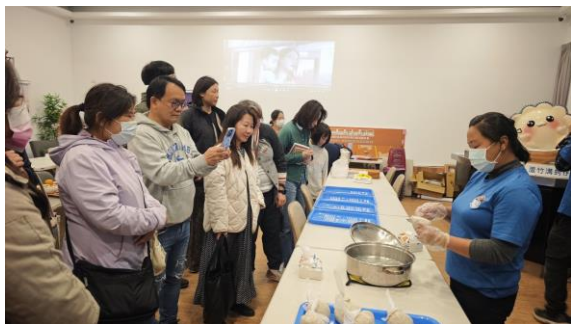
圖 3：食農講座：沿海、歷史、虱目魚—蘆竹溝食農脈絡。