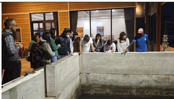
圖 9：養殖業者實地解說魚產業現況與在地特色。