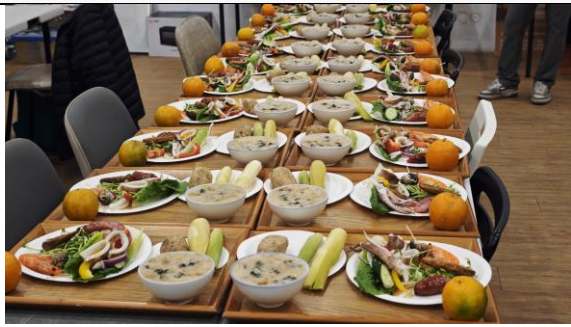
圖 7：在地師傅示範與教師合作完成餐點製作及擺盤。