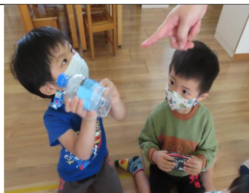
我找到資源回收標章