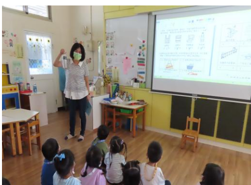
裝水時要使用水瓶，少使用寶特瓶