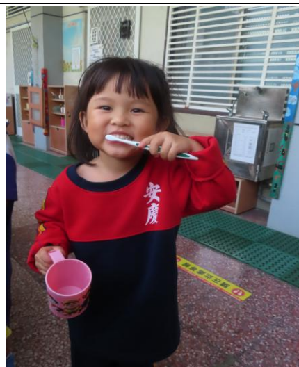
養成良好的潔牙好習慣