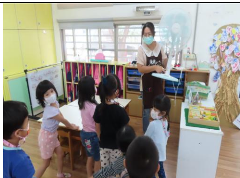
電風扇上有省電標章