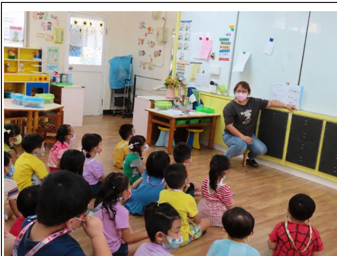
學習保護眼睛的好方法