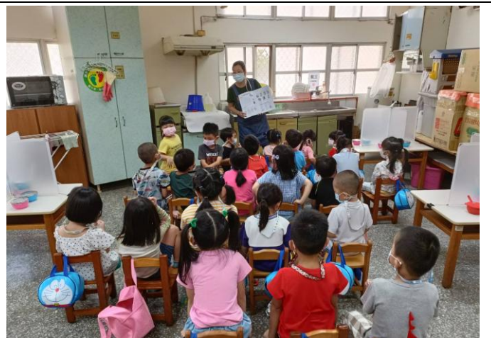
老師帶到餐廳實際洗手教學