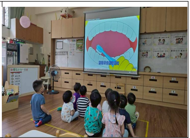
學習正確的刷牙方式