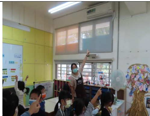
找找看省電標章在哪裡