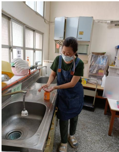
洗手時要使用洗手乳