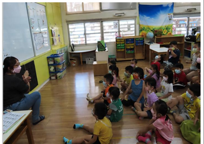
能分辨出正確保護眼睛的好習慣