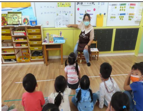
老師介紹什麼是環境保護