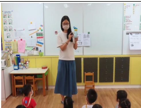
容器、空瓶要檢查是否有積水