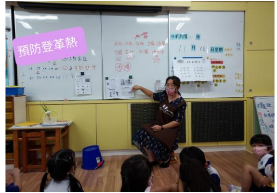
介紹預防登革熱的方法