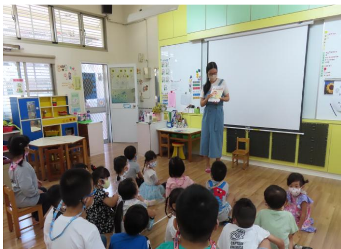
認識腸病毒的病徵