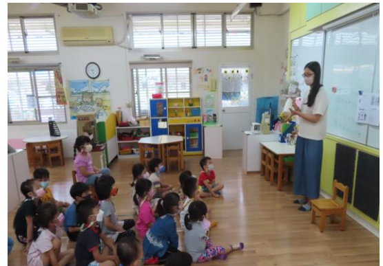
蚊子會躲在哪裡呢？