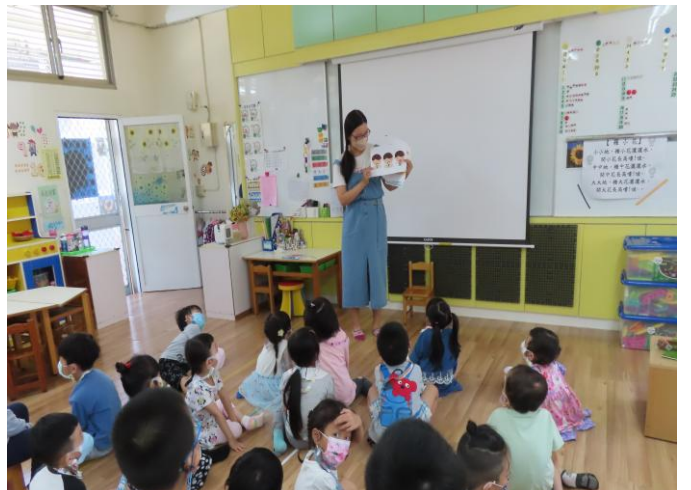
得到腸病毒手、足、口都會有紅疹水泡