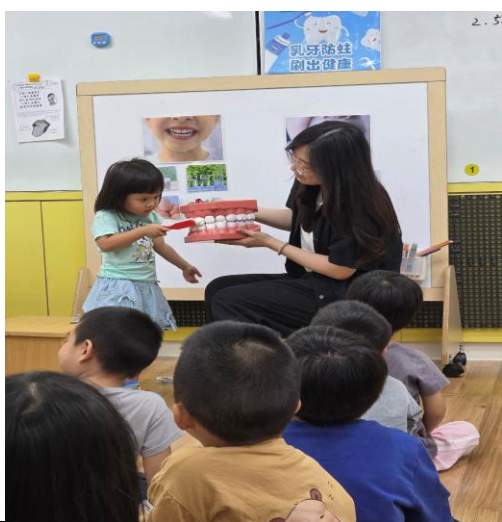
先刷門牙→上下排的內側也要注意