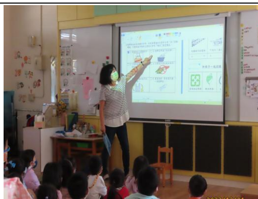
少使用塑膠做成的東西