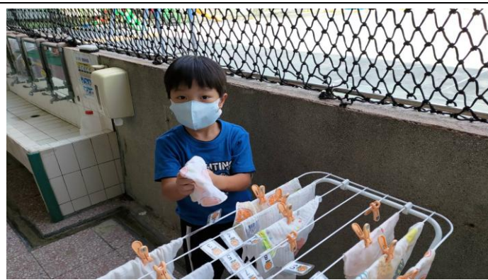
洗完手記得要把手擦乾淨唷～