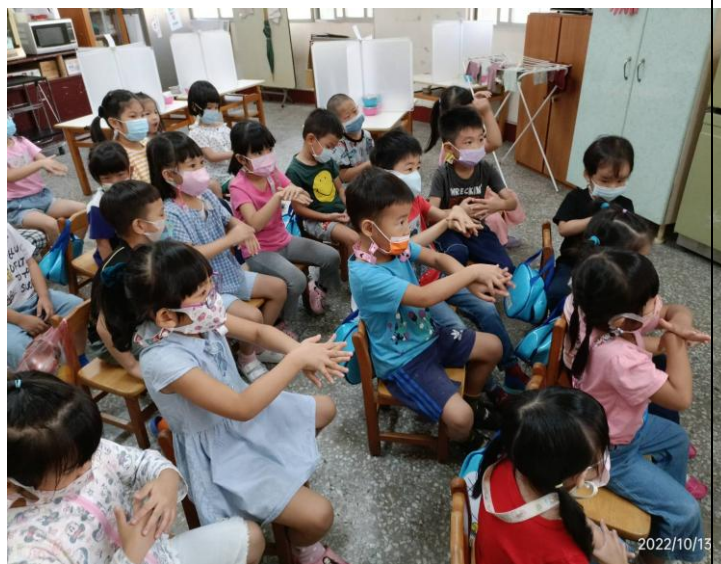
大家一起練習洗手七字訣