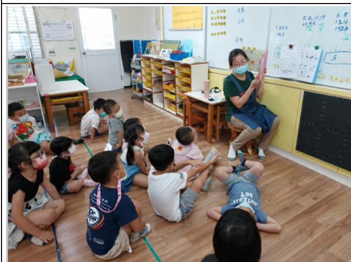
看書時眼睛不要離太近