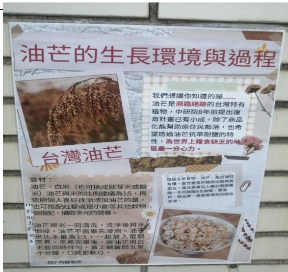
說明：各組介紹台灣油芒植物的栽種的文字