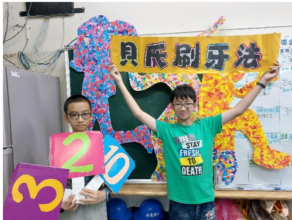
說明：表演同學們熱情的宣導貝氏刷牙法