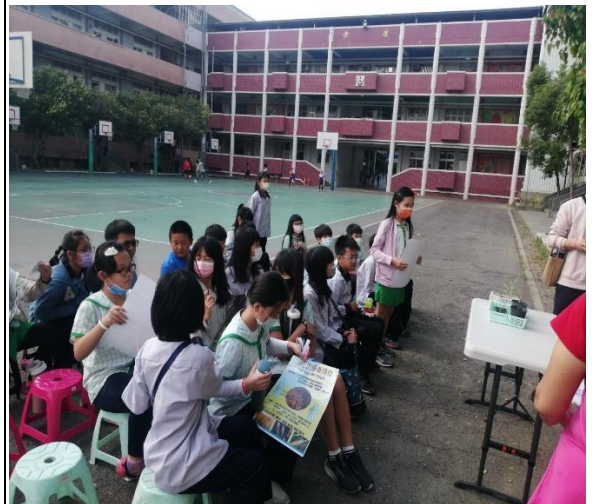
說明：各小組認真的學習及發表