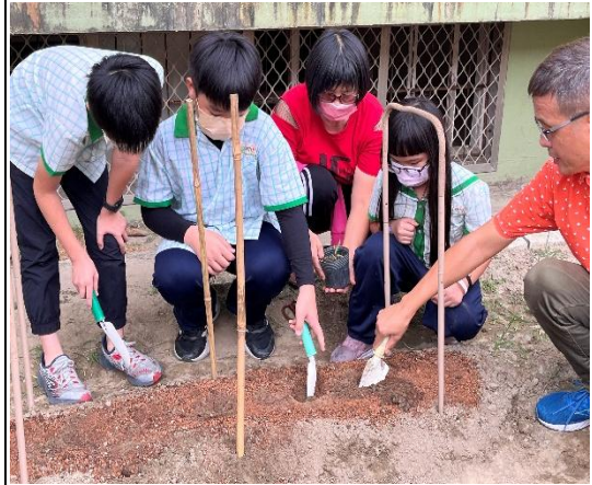
說明：主播介紹學校的情境宣導