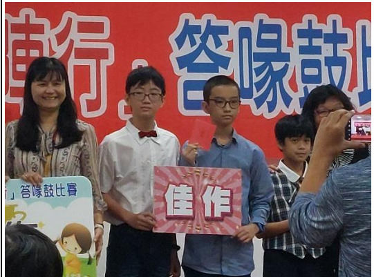
說明：辛苦的練習終究會被看見