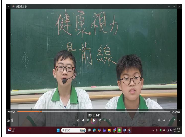
說明：主播們熱情播報健康報報