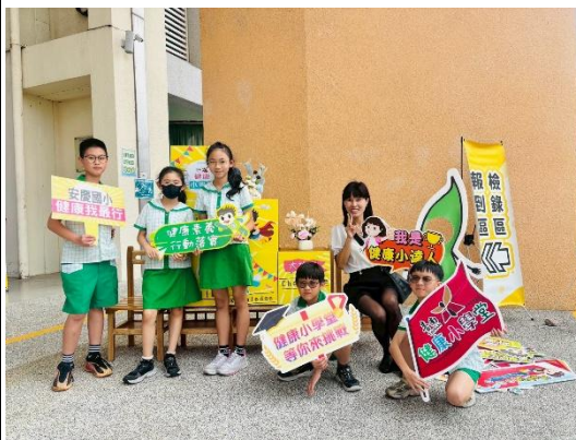
說明：辛苦的練習終究會被看見