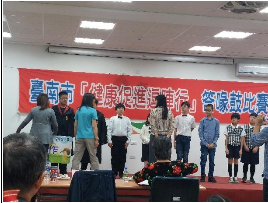
說明：參加比賽獲得佳作接受表揚