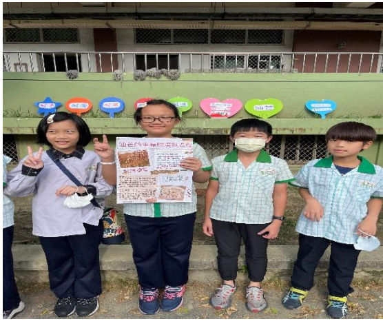
說明：主播介紹台灣油芒植物的栽種導