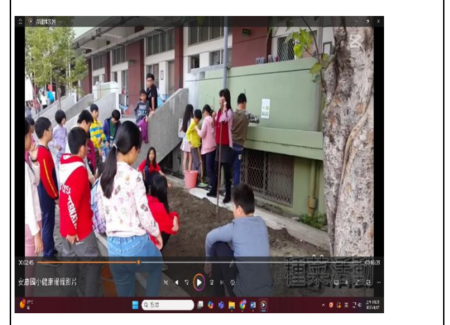
說明：主播介紹本校的食農課程