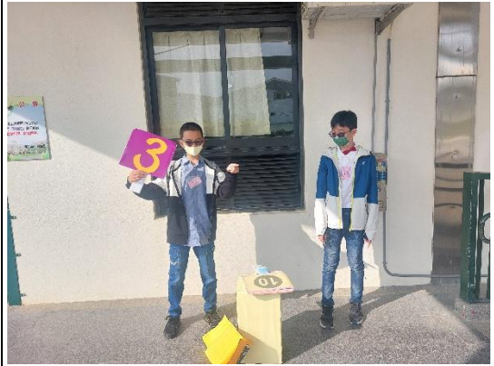
說明：同學介紹刷牙333的時機和運用