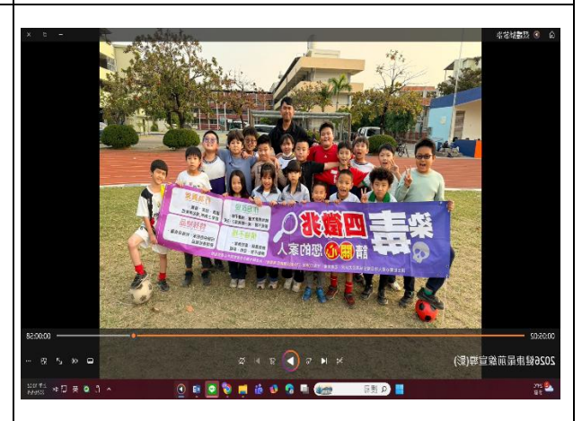
說明：主播介紹學校的球隊健康運動