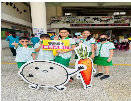
說明：健康知識大挑戰比賽