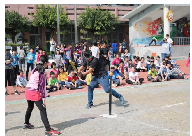
師生樂樂棒球對抗賽