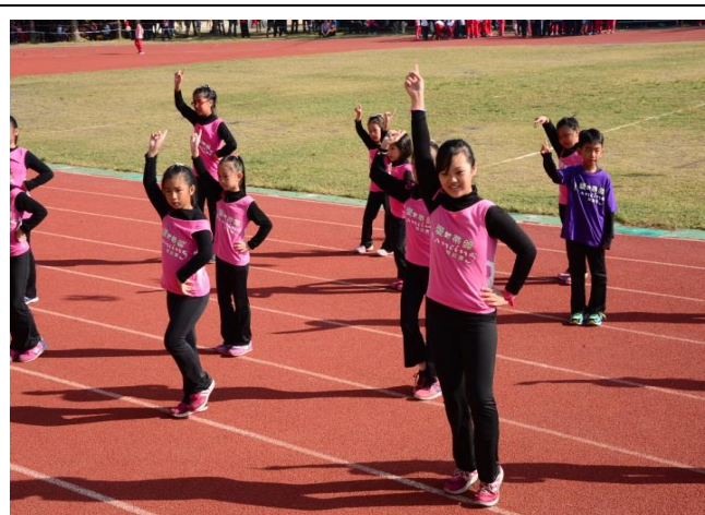
學生課後社團-熱舞社