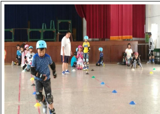
學生課後社團-直排輪