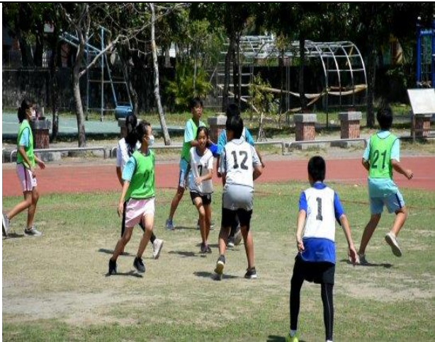
和順盃飛盤爭奪賽