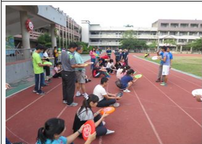
週三下午教師體育活動研習-飛盤