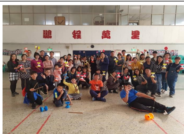
週三下午教師體育活動研習-扯鈴