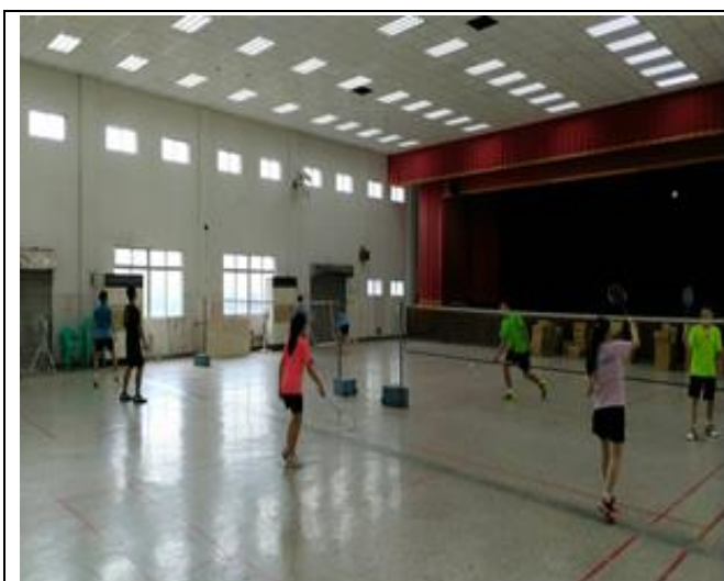
課後教師羽球社團