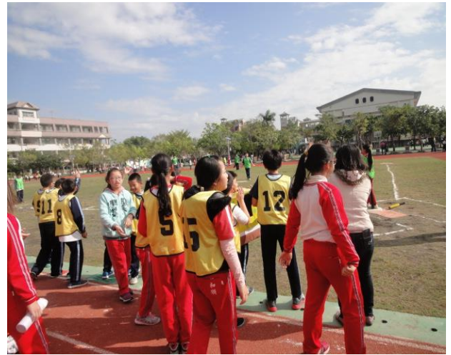
六年級班際樂樂球比賽