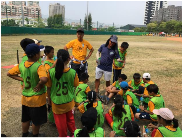
五年級班際樂樂球比賽