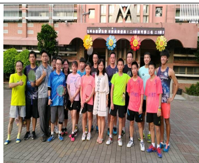
課後教師羽球社團