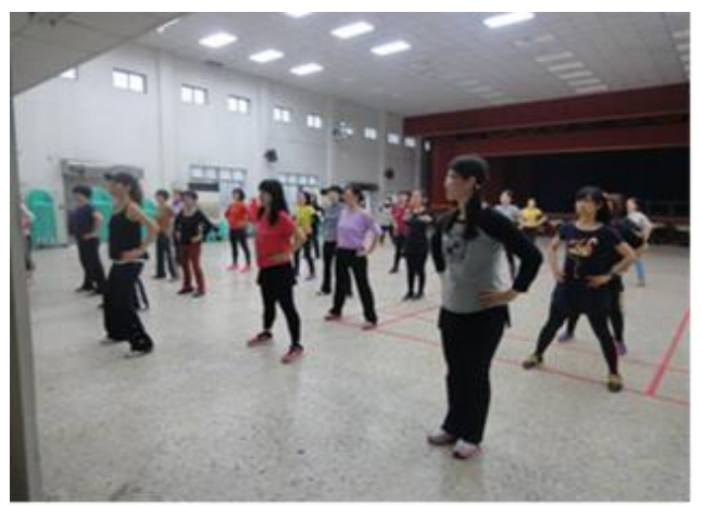
課後教師韻律舞社團