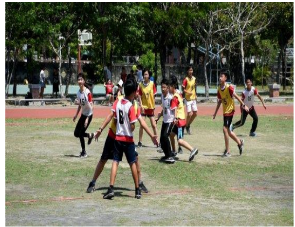
和順盃飛盤爭奪賽