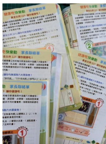
在聯絡簿上張貼家長聯絡單