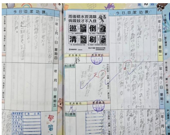
在聯絡簿上張貼登革熱防治訊息