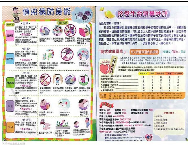
在聯絡簿分享傳染病防身術