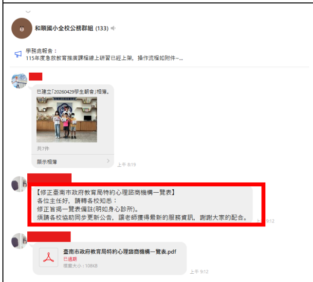
在群組提供心理健康諮商訊息