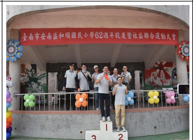
教職員工生一起參加運動大會