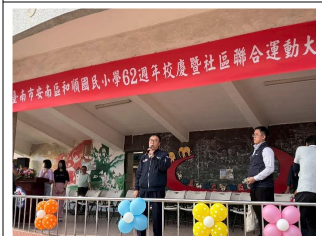
辦理校慶暨社區聯合運動大會