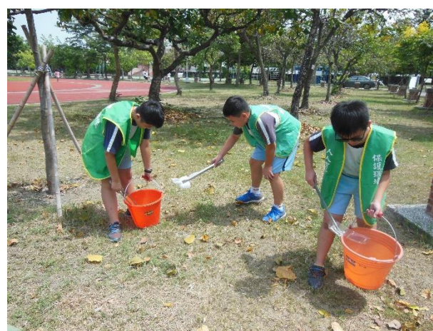
衛生服務隊每天巡檢校園環境