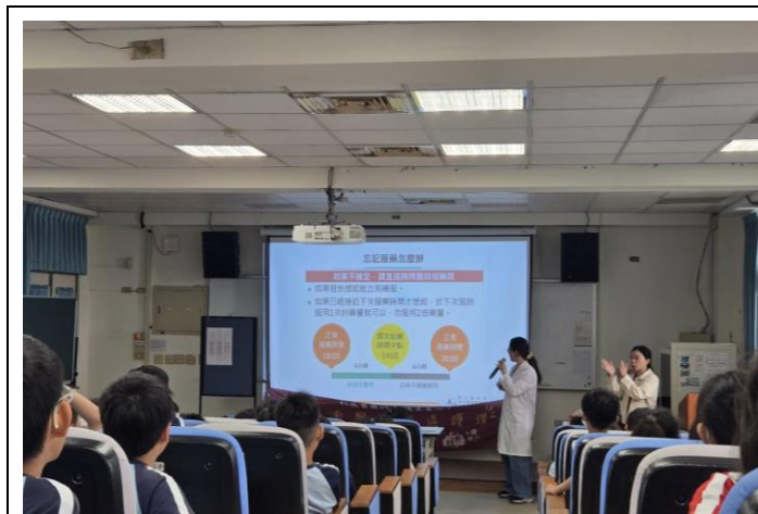
認識正確用藥五大核心能力