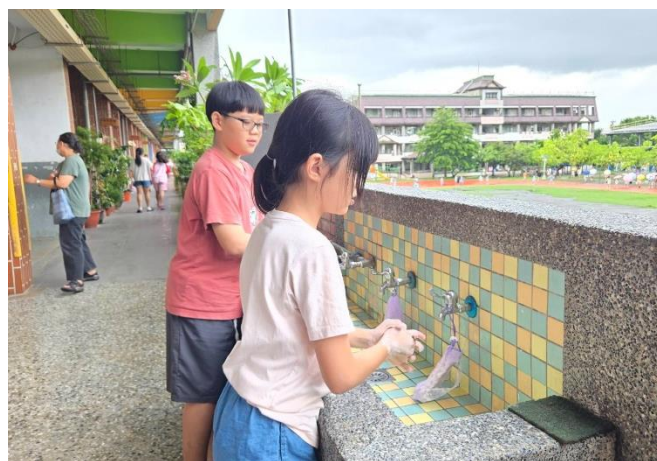
透過打掃勞動，維護校園環境整潔