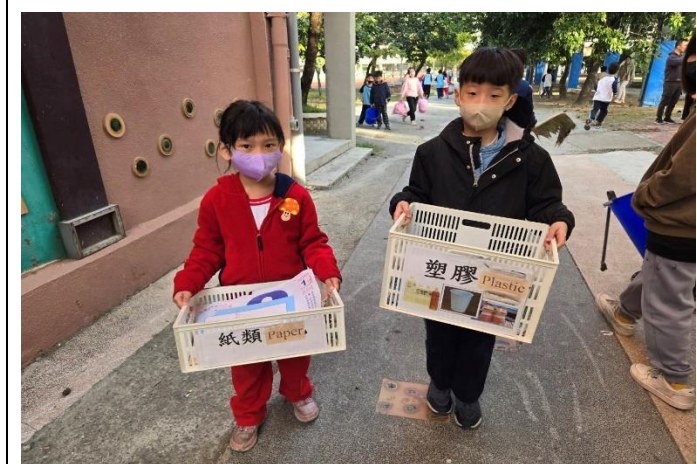
垃圾分類減量愛地球