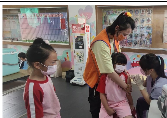
學生定期接種流感疫苗