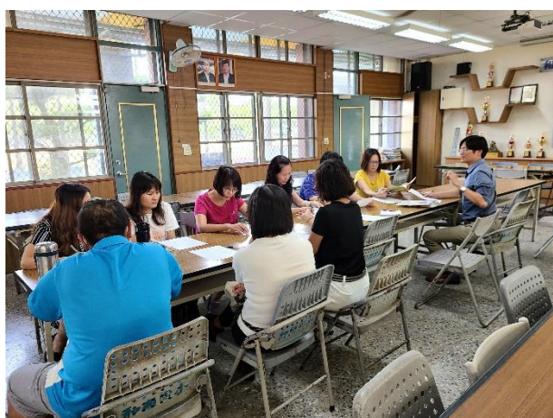
校長召開健康促進小組會議