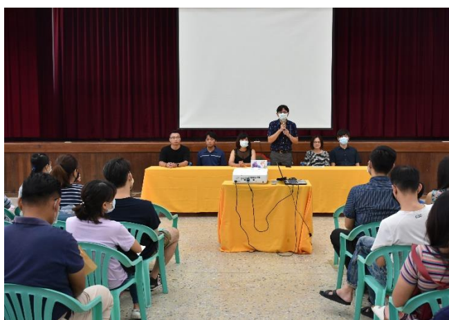
校長於新生訓練向家長說明健康促進的重要性