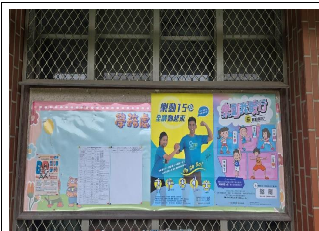
在學校公布欄張貼健康促進海報