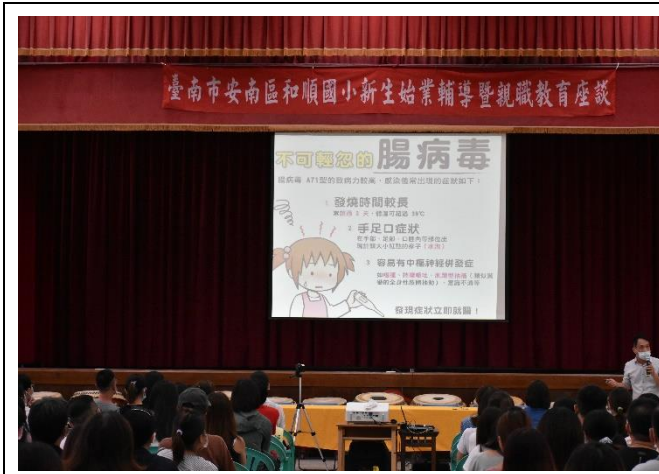
於班親會向家長說明健康促進事項