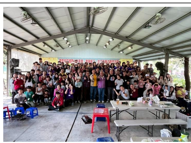
校長帶領學生及家長進行春遊活動