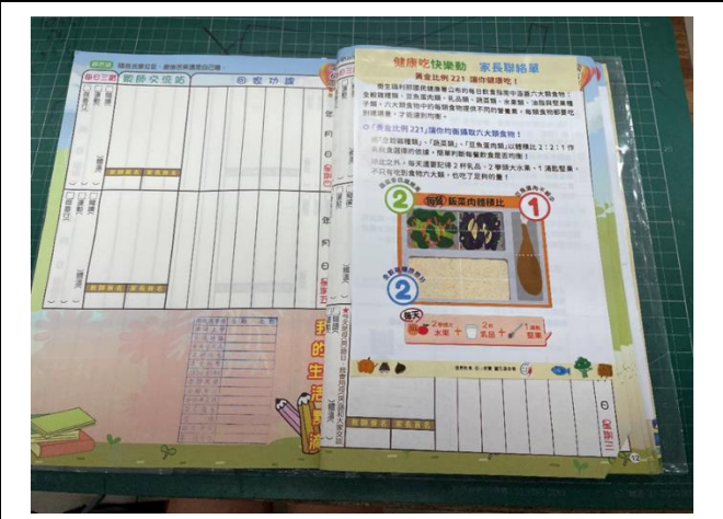
將健康促進宣導單張貼於家庭聯絡簿