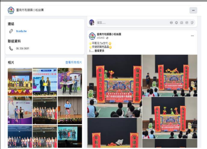
於臉書分享視力保健宣導活動的成果