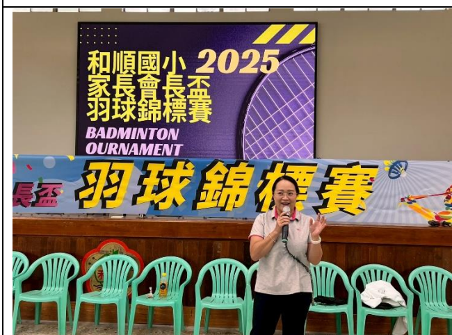
校長帶領學生及家長參加羽球錦標賽