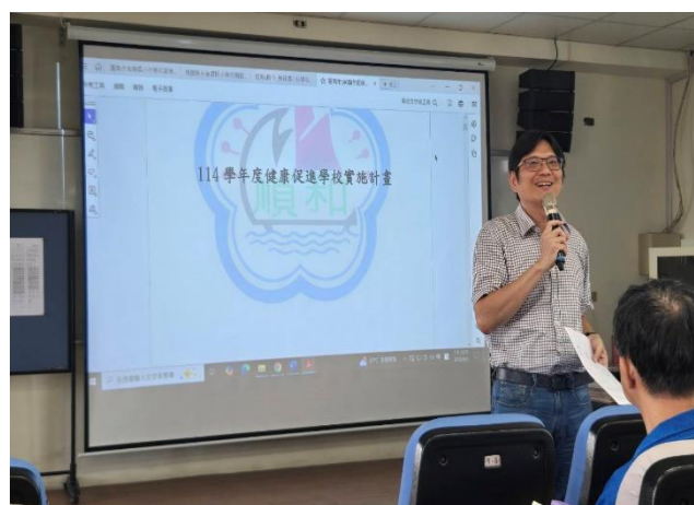
在校務會議中說明健康促進工作