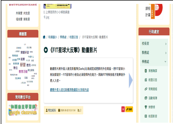
於學校網站公告健康宣導訊息