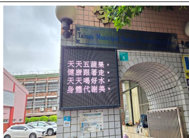
在校門口跑馬燈宣導健康促進議題