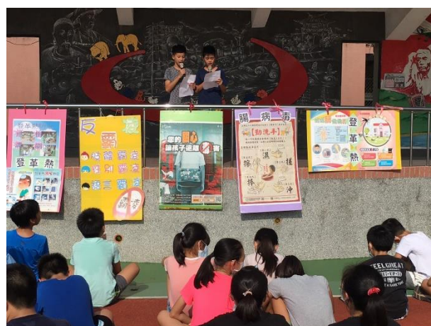
小市長團隊在朝會宣導傳染病防治