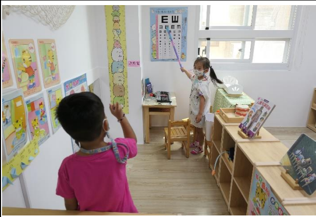
健康促進角色扮演