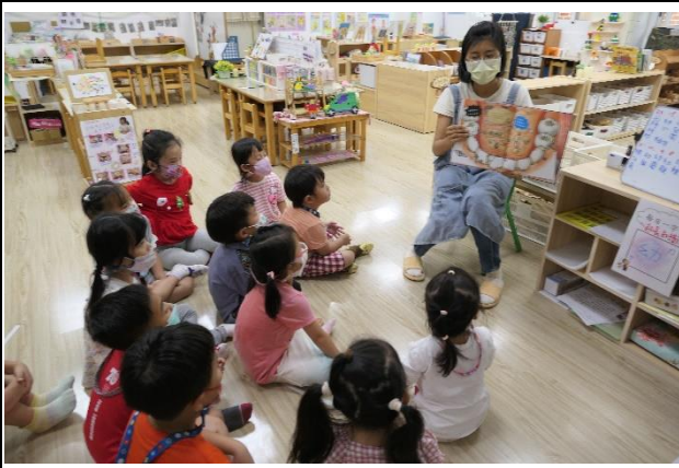
健康促進相關議題繪本閱讀