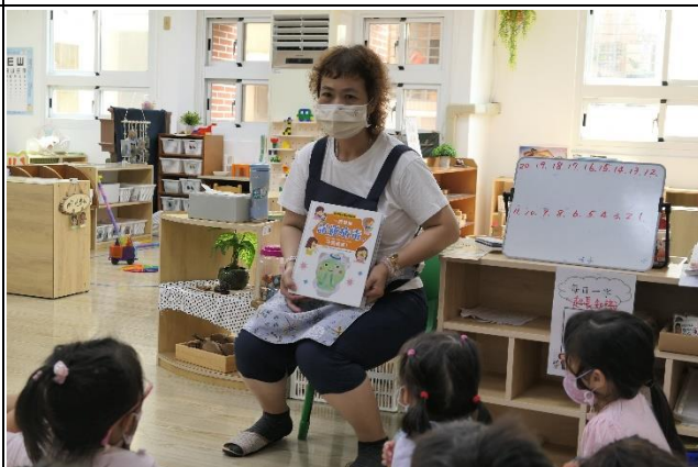
健康促進相關議題繪本閱讀