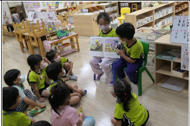
健康促進相關議題繪本閱讀