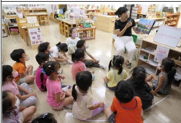
健康促進相關議題繪本閱讀