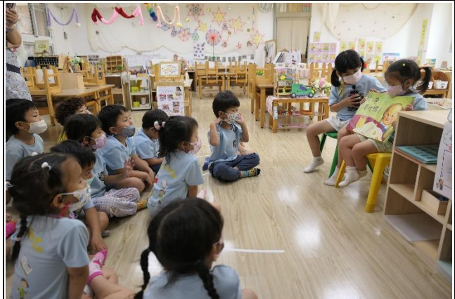
健康促進相關議題繪本閱讀