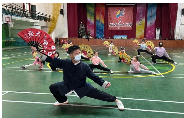
太極拳太極扇社團