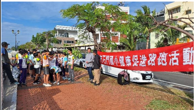
健康促進路跑活動