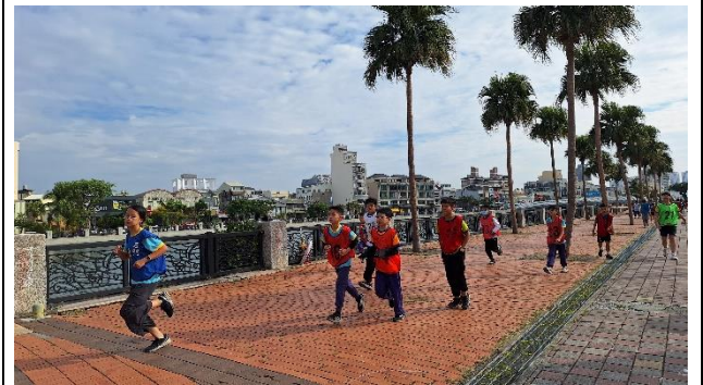
健康促進路跑活動