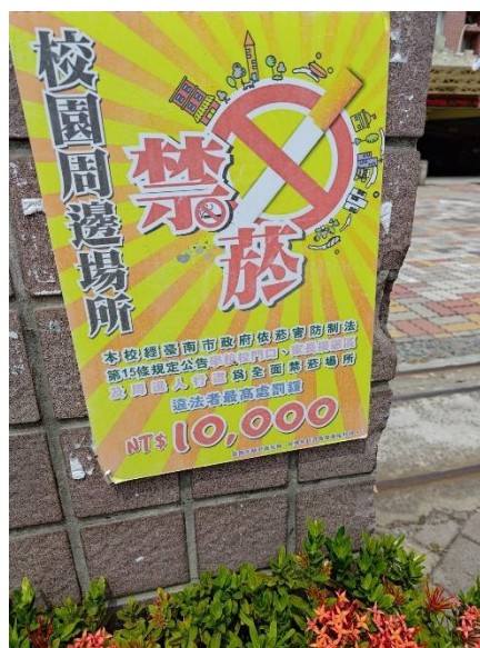
無菸無毒環境營造