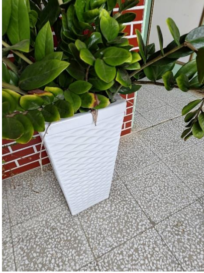
盆栽移走底盤，避免滋生蚊蟲