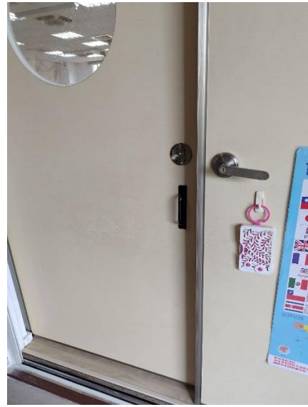
設置防蚊貼片，減少蚊蟲