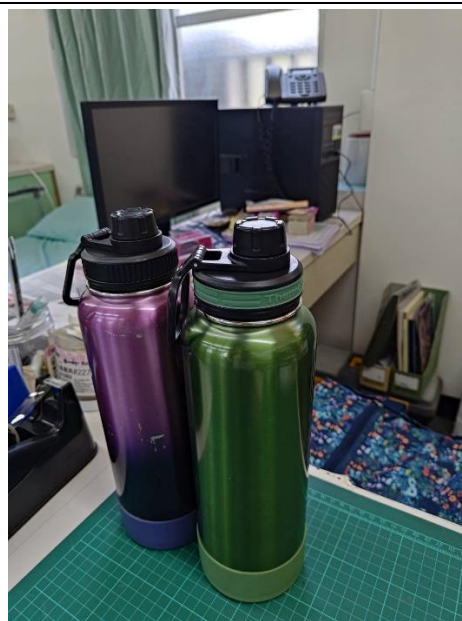
教職員喝足白開水