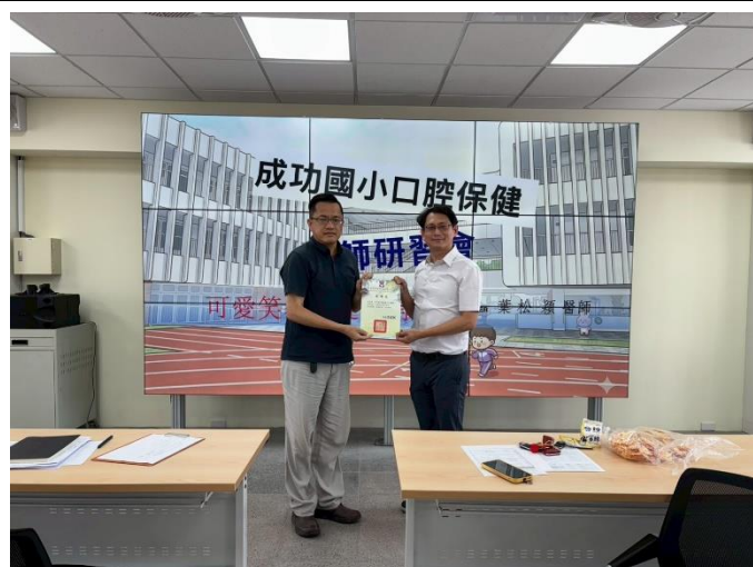
說明：校長頒發感謝狀