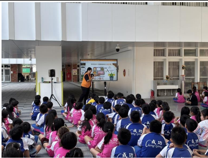
說明：於兒童朝會時進行宣導