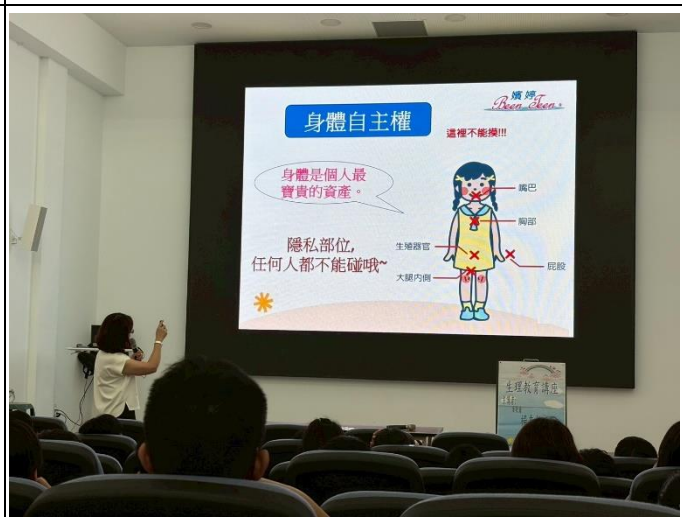
說明：我的身體我做主，了解身體自主權