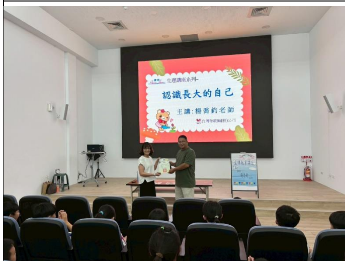
說明：主任頒發感謝狀