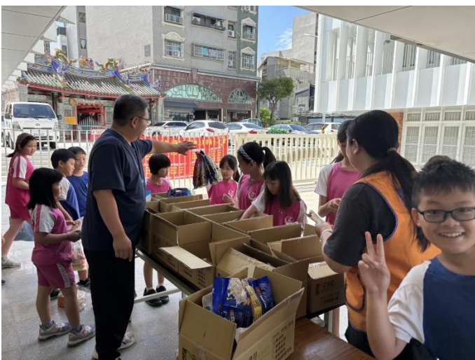
說明：施比受更有福