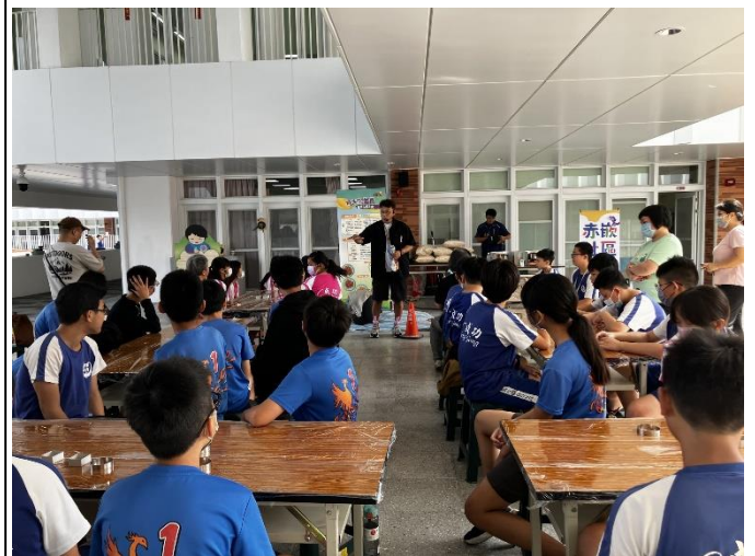
說明：學生認真聽講