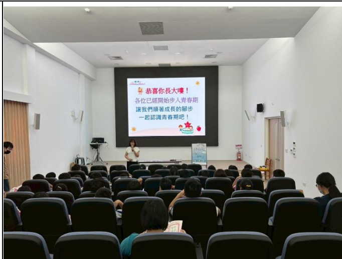
說明：學生認真聽講