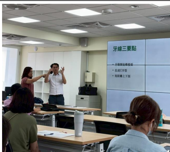
說明：牙醫師示範如何使用牙線