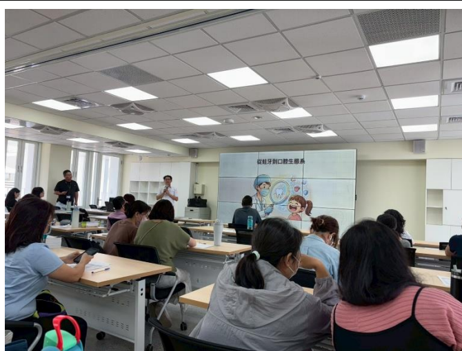
說明：從蛀牙到口腔生態系