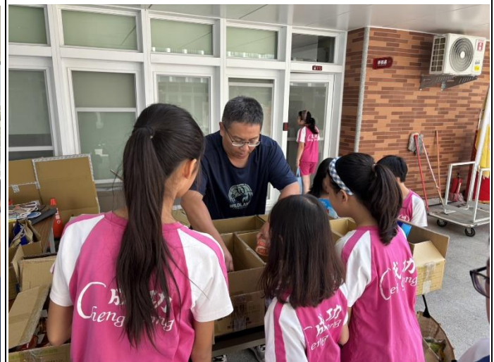
說明：透過一日物資募捐幫助他人