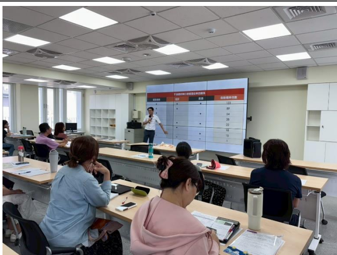
說明：不良嗜好與口腔癌發生率的關係