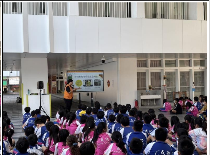
說明：珍惜食物，從你我生活開始