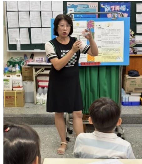
說明：學生疾病照護自主管理-護理師教患有氣喘的學生如何使用噴劑