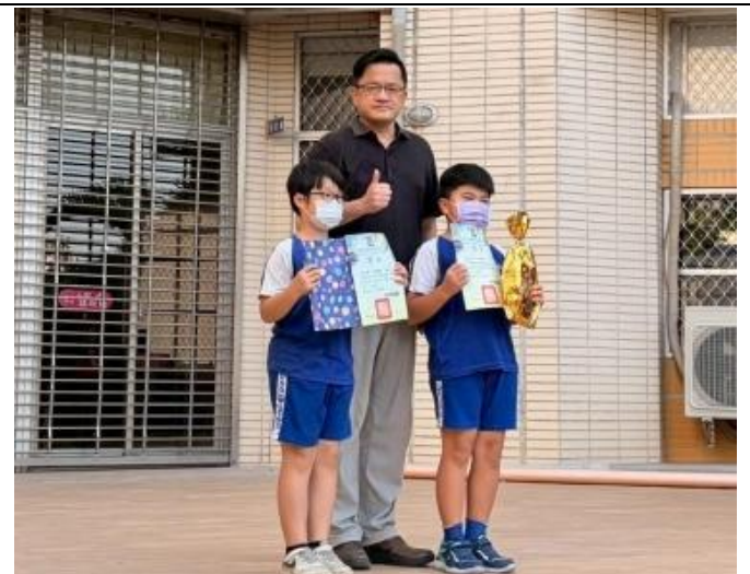
說明：學生集滿健康護照公開上臺表揚