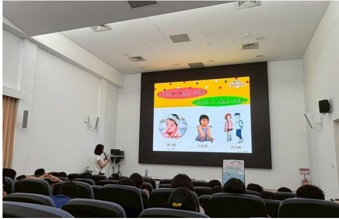
說明：為高年級同學進行生理講座