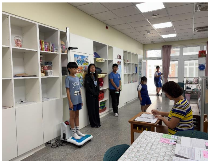
說明：體格缺點學生追蹤矯治-每學期替過重、過輕的學生量身高體重