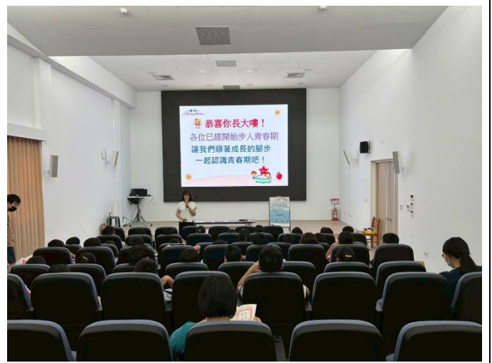
說明：為高年級同學進行生理講座