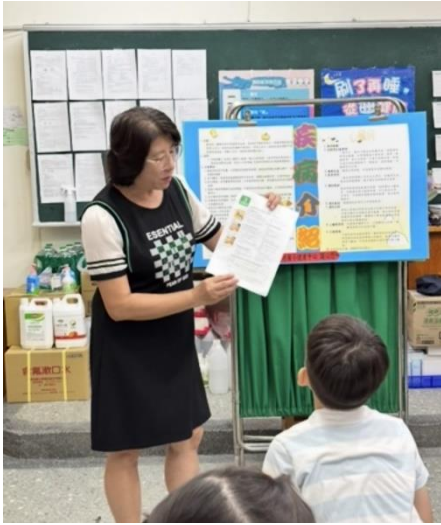
說明：學生疾病照護自主管理-護理師針對患有氣喘的學生作疾病介紹