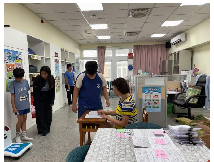
說明：體格缺點學生追蹤矯治-透過個別衛教讓學生更了解自己的身體健康