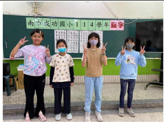
說明：寫字比賽選手合照