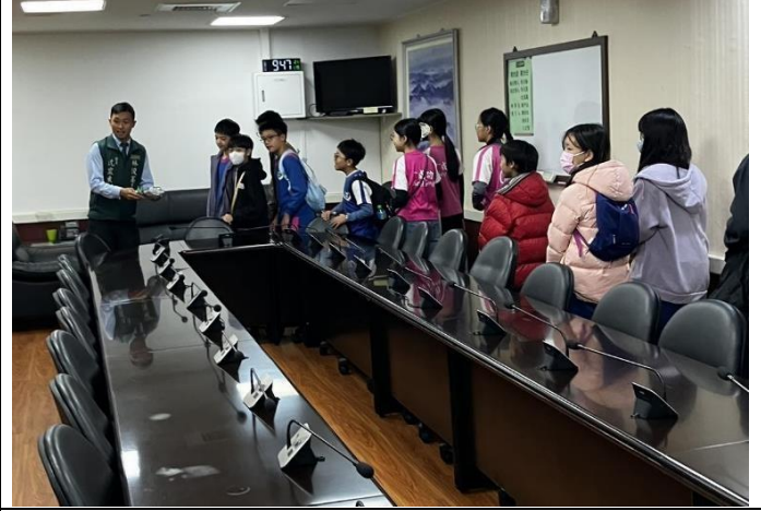
說明：滿心期待地進到議會