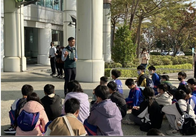
說明：進到市議會前先聽大學長說明注意事項