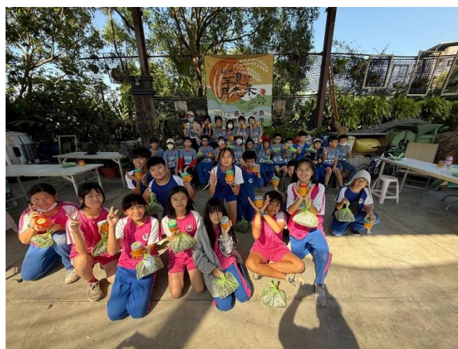
說明：帶著自製泡菜滿載而歸