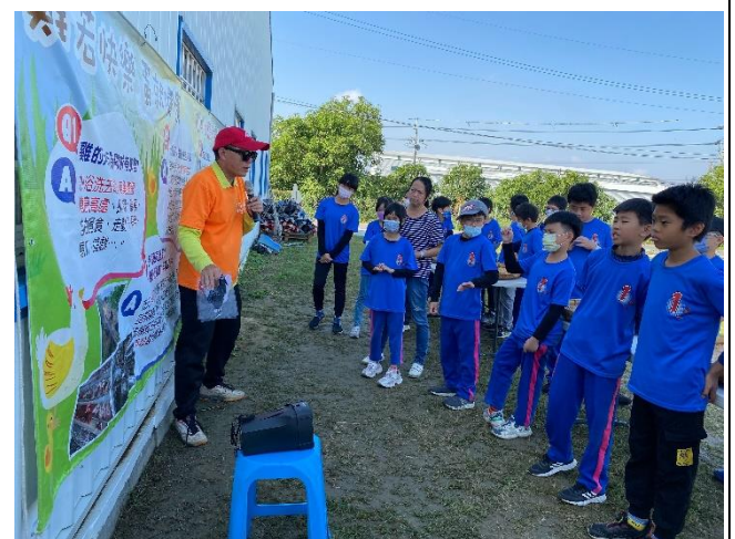
說明：認識阿中生態農場