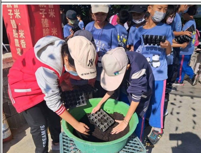
說明：農夫一日體驗