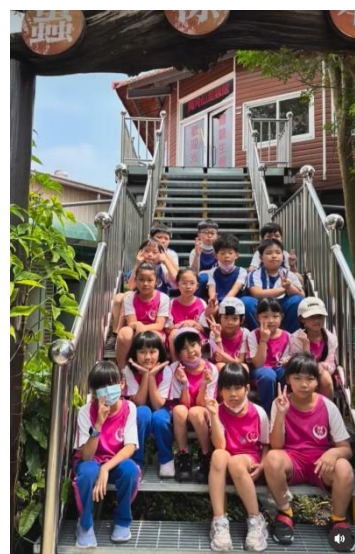
說明：參觀完昆蟲標本，來張合照。