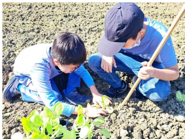
說明：農夫一日體驗