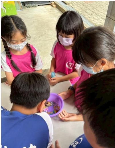
說明：仔細觀察雞母蟲