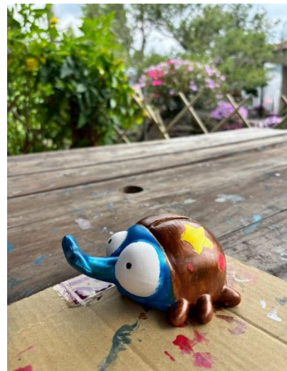
說明：獨角仙存錢筒創作