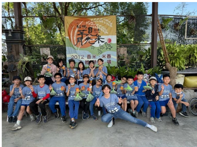
說明：帶著自製泡菜滿載而歸