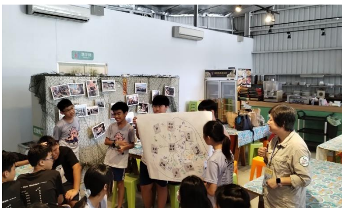
說明：小組發表海洋關係圖