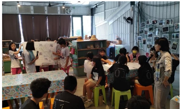
說明：小組發表海洋關係圖