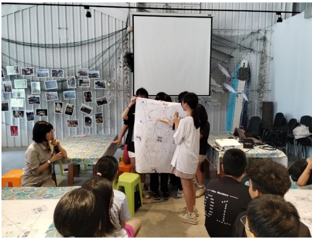
說明：小組發表海洋關係圖