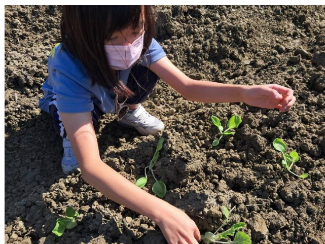
說明：農夫一日體驗