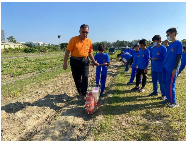
說明：玩中學，學中玩。