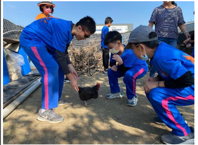
說明：呱呱雞互動樂，近距離接觸雞