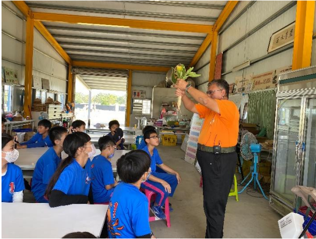
說明：仔細學習如何拔蘿蔔