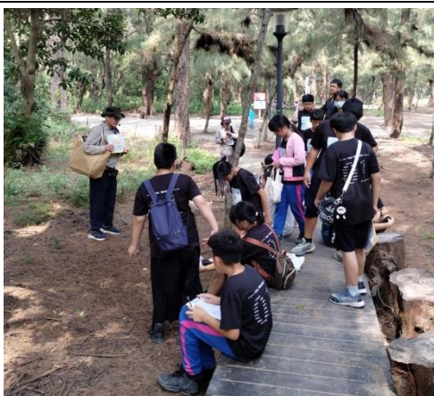
說明：認識海洋森林環境