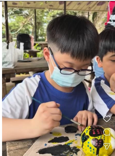
說明：獨角仙存錢筒創作