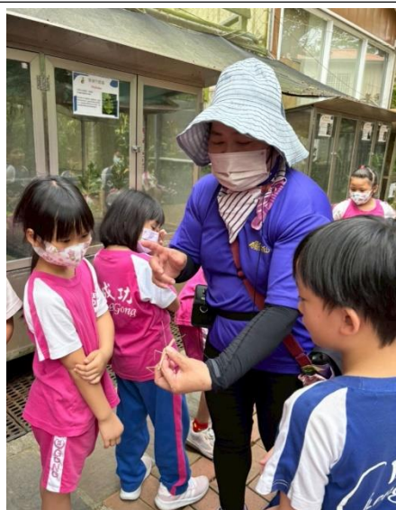
說明：近距離觀察竹節蟲