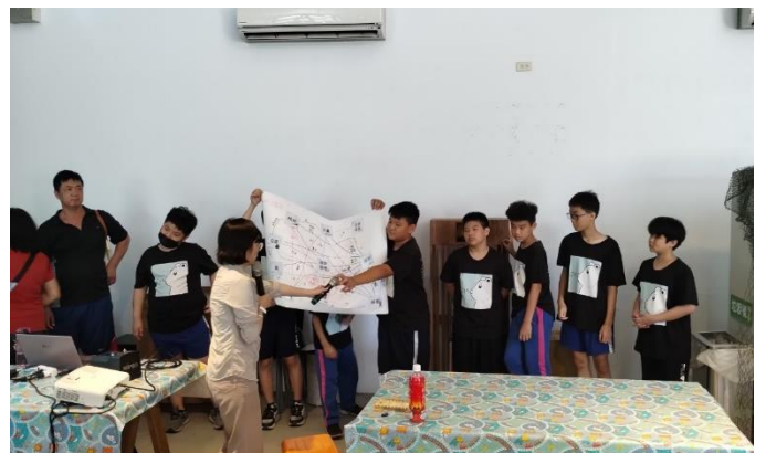
說明：小組發表海洋關係圖