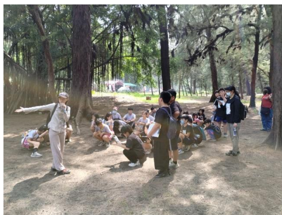
說明：認識海洋森林環境