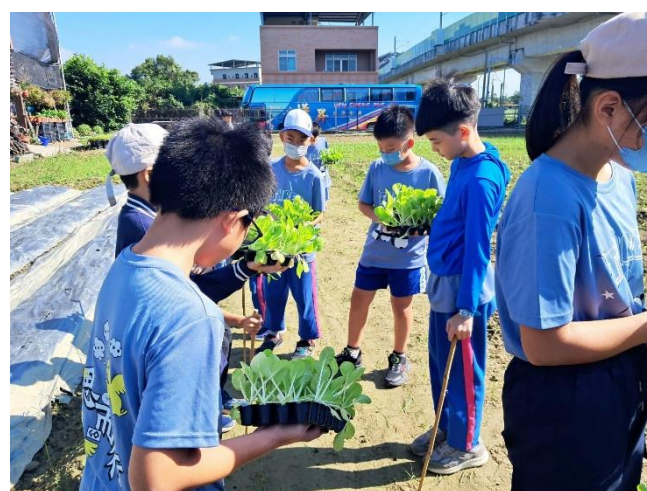
說明：農夫一日體驗