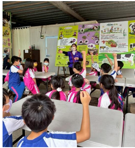
說明：認識獨角仙的一生有獎徵答