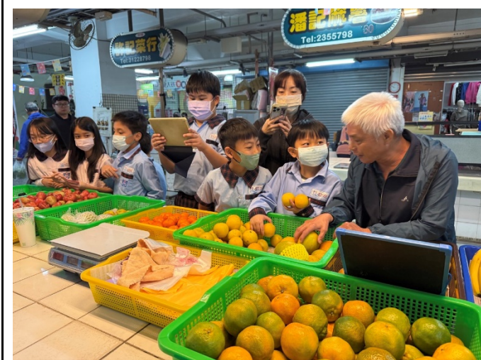
說明：開元菜市場飲食課程