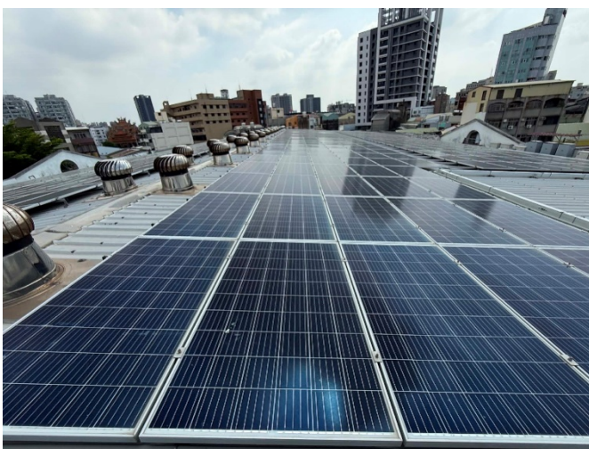
說明：學校頂樓安裝太陽能板