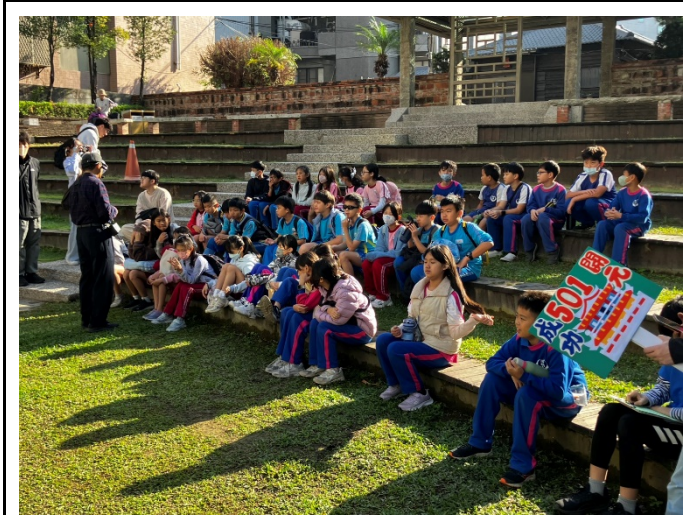
說明：走讀課程-赤崁樓