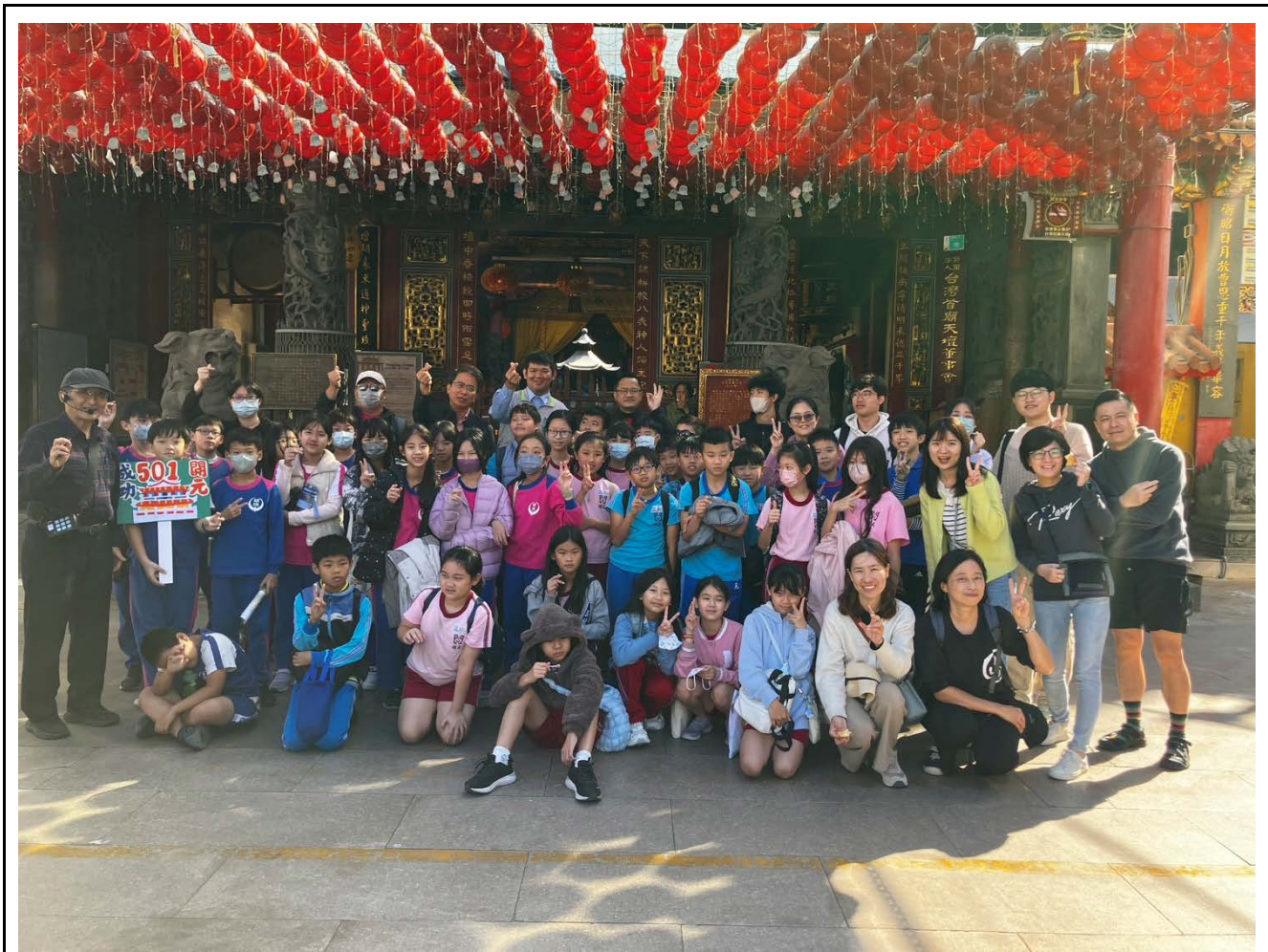
說明：走讀課程-赤崁樓