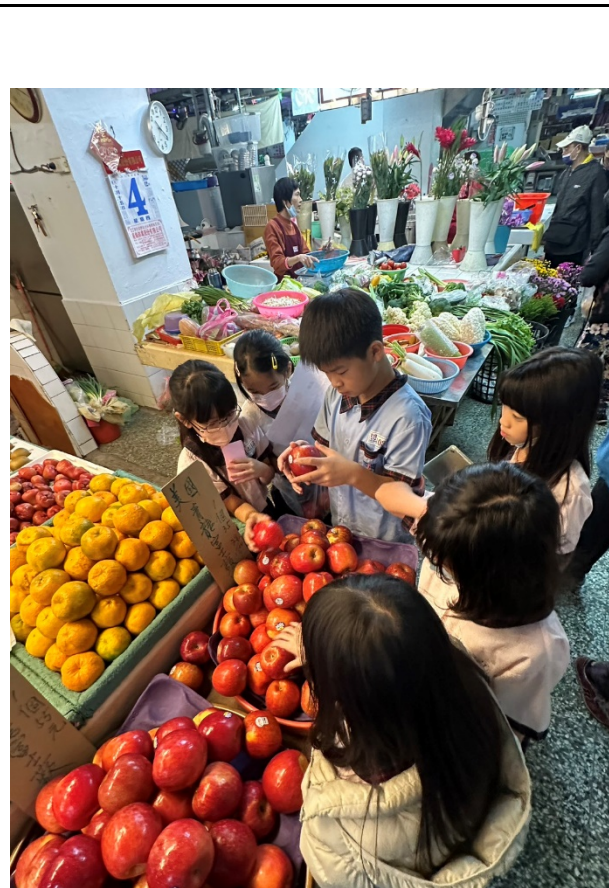
說明：開元菜市場飲食課程