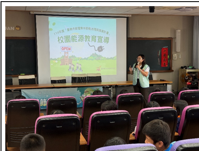
說明：能源教育課程