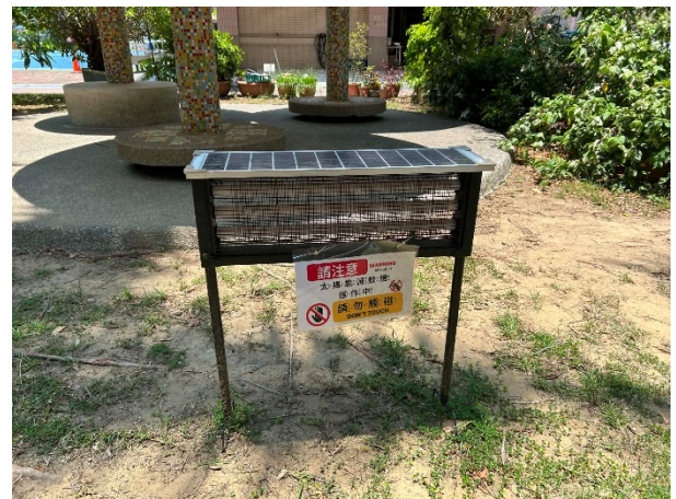
說明：使用太陽能滅蚊燈(目前五座)