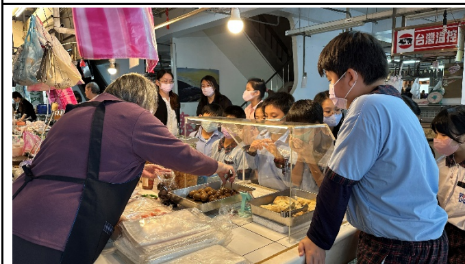
說明：開元菜市場飲食課程