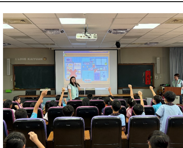
說明：能源教育課程