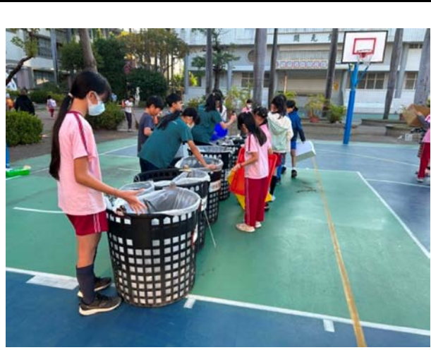
說明：資源回收整理