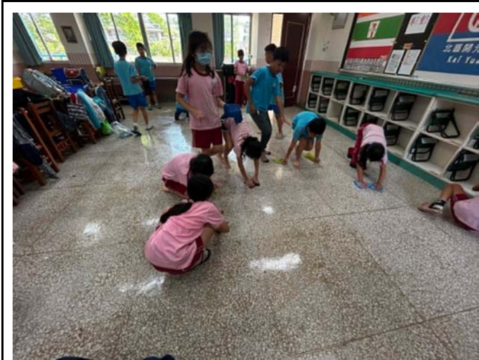
說明：學生教室環境清潔