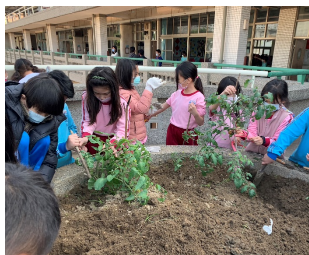
說明：指導學生種菜