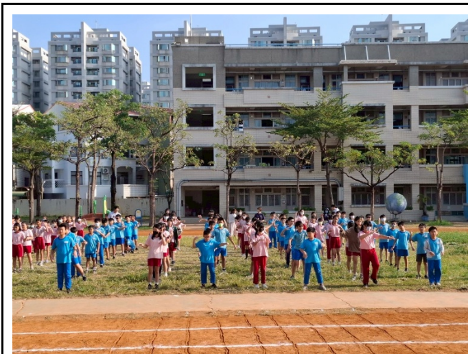
說明：學生每週三健康操