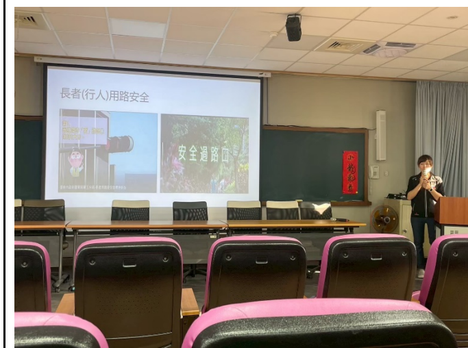
說明：交通安全宣導