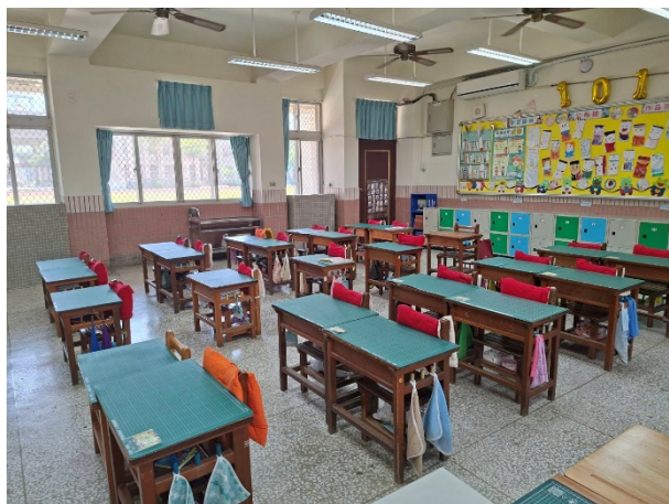
說明：下課教室淨空