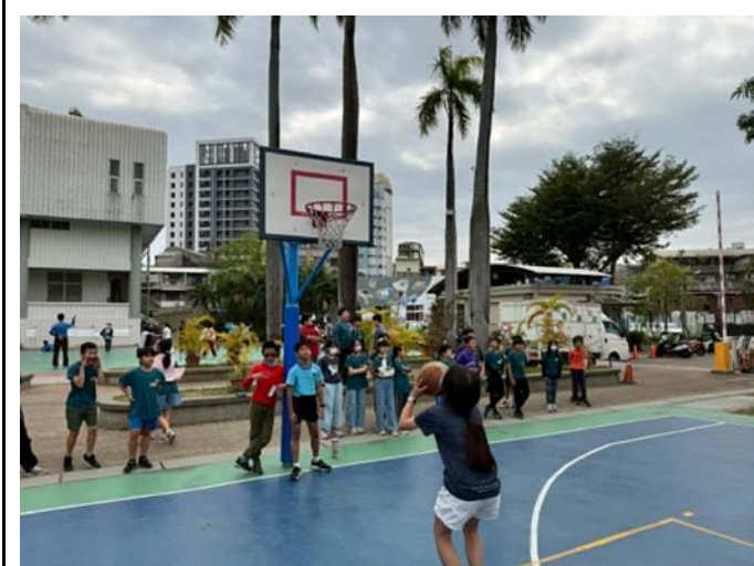
說明：學生下課戶外活動