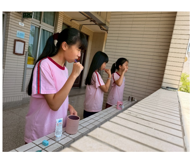
說明：學生飯後潔牙