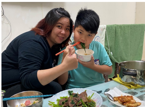
說明：指導學生種菜回家煮