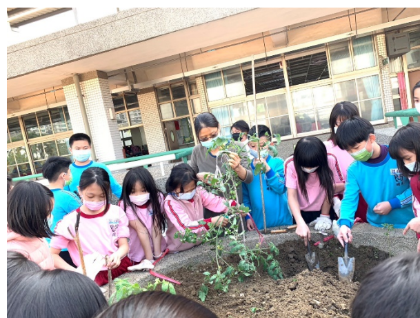
說明：指導學生種菜