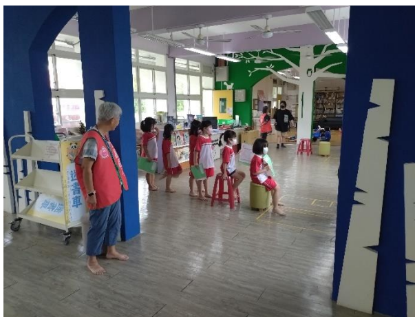
學生安靜排隊等待檢查。