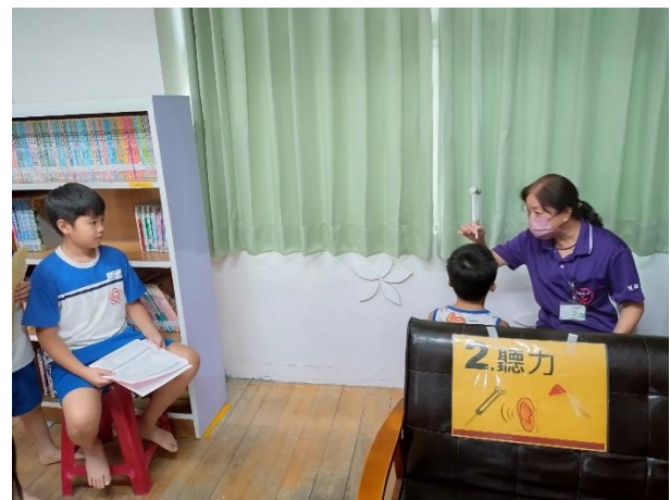
護理師測量學生聽力。