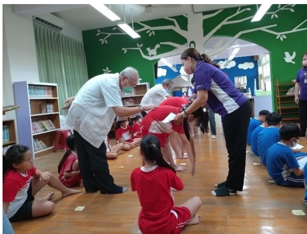
醫生進行脊柱檢查，確認學生是否有脊柱側彎的情況。