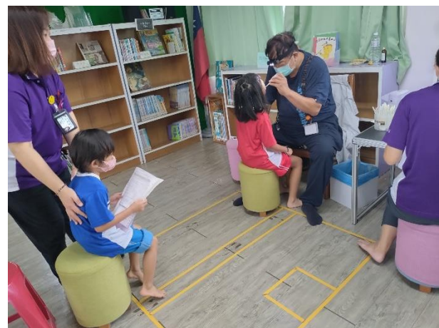
牙科醫師檢查學生口腔狀況。