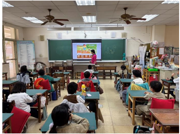
老師結合健康課進行營養教育。