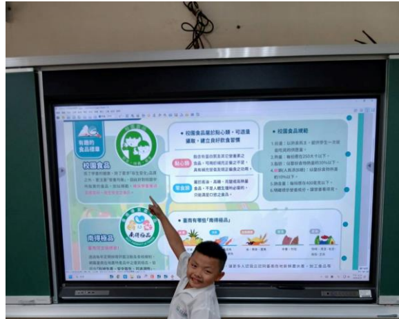
學生了解並能指出對應的正確標章。