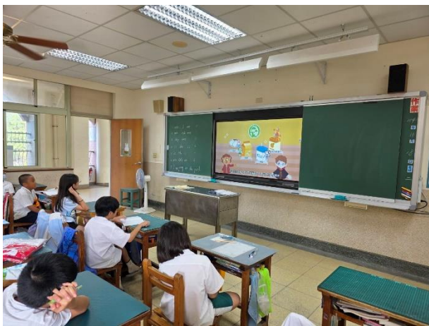
學生觀看台灣標章介紹影片。