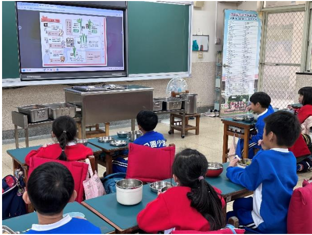
學生利用午餐時間觀看餐前五分鐘短片。